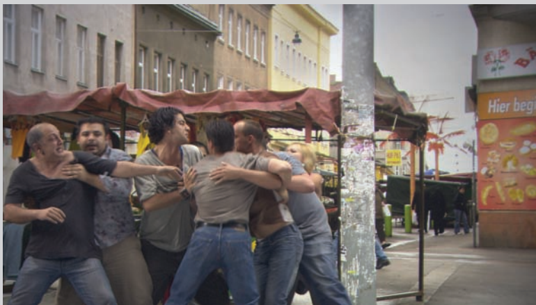
Mark Lewis, The Fight , 2008, single screen projection, 5 mn 27 s, HD video, film still courtesy Monte Clark Gallery (Vancouver)/Clark & Faria (Toronto)/galerie serge le borgne (Paris).

The constellation of temporary exhibitions, national representations, and thematic exhibitions that take over Venice for the first week of June every other year is usually a grand affair that defies any type of human scale. Surprisingly, that was largely untrue this year. Perhaps as a side effect of the slowing world economy, the majority of artworks and exhibitions seemed less glittery and over the top. This new-found seriousness at the Venice Biennale ultimately allowed a good number of interesting, intelligent, and compelling artworks to stand out without reverting to the shock-and-awe treatment of previous years. Within the realm of photography and video-based art, three artists' works are particularly worth a second look: those of Mark Lewis (Canada), Atta Kim (Korea), and Fiona Tan (Holland). Though each is quite different in content, all shared a simplistic and somewhat subdued approach that successfully embodied very powerful artistic voices.