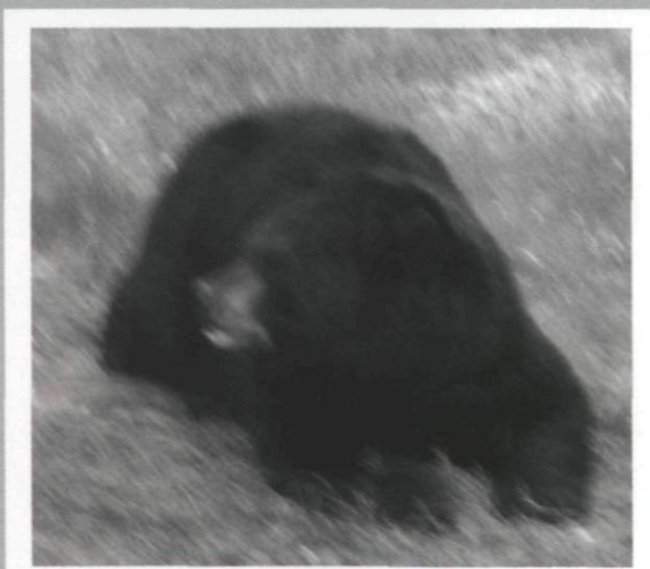
Reno Salvail, Le réveil de l'ours noir , 2006, de la série Les rivières de feu , épreuve au jet d'encre sur papier chiffon, 120 x 137 cm

Huron-Wendat Guy Sioui Durand has a doctorate in critical sociology and is an independent curator specializing in contemporary and Aboriginal art. Co-founder of the magazine Inter and of the artist-run centre Lieu (Quebec City), he has published three books, including L'art comme alternative (1997). He writes for periodicals and catalogues and on the Internet. He was the Aboriginal consultant for Espace 400 e (Québec 1608–2008). [www.siouidurand.org]