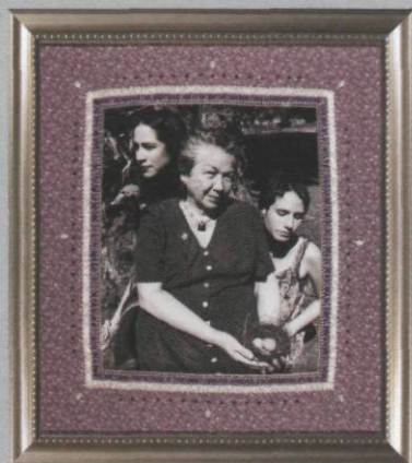
Shelley Niro, Le temps voyage à travers nous , 1999, épreuve argentique, 94 x 83,8 cm, collection du Musée canadien de la photographie contemporaine, Ottawa

comme elle se décrit. Assurément l'humoristique facture hypermoderne des grandes photos couleurs flirtait avec les canons des images publicitaires. Des membres d'une famille autochtone (ex. : Portrait de famille (Des Indiens sur une couverture) ) y posaient dans divers scénarios caricaturant l'hyperconsommation nord-américaine, tout en exhibant des artefacts traditionnels amérindiens. Ces œuvres ne pouvaient qu'accrocher l'œil... des médias !