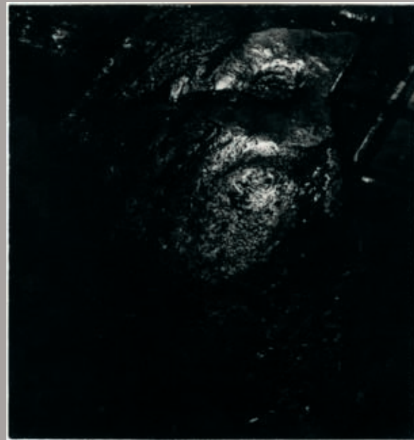
fig. 4 : Jean-Paul Mousseau (1927-91), Mélanographie aux eaux dormantes , vers 1953, épreuve au gélatinobromure argentique à surface mate, tirage d'époque / Mélanograph with still water , ca. 1953, silver gelatin bromide print with matte surface, period print, 18 x 17 cm