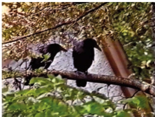
Don't Eat Crow , 1994, video still / image tirée de la vidéo, 28:30 min., courtesy of / permission de Collection of the Canadian Museum of Contemporary Photography

séance and part performance, the ambiguous outcome of detailed planning and organization, it fails to reach the spirits of the “two Hanks” – country-music stars Hank Williams and Hank Snow – although it gives us a rich and eclectic visual spectacle. Fog falling from suspended blocks of dry ice drifts through a darkened room while music by the “two Hanks” plays, calling to them in the beyond. The audience members stare blankly in the dark and are revealed in the eerie green glow of night-vision video, becoming phantasmagoric participants, halfway between us and the anticipated “Hanks.” A wailing theremin and Askeveld’s percussive bass collide with the country music on the audio track, adding another level of complexity and disorientation. The séance fails; the “Hanks” never appear. At the end of the video, the audience is relieved of the otherworldly atmosphere when the room lights come up, the audience applauds the performance and the performers, and the “disorientation scientist” acknowledges his success to the crowd.