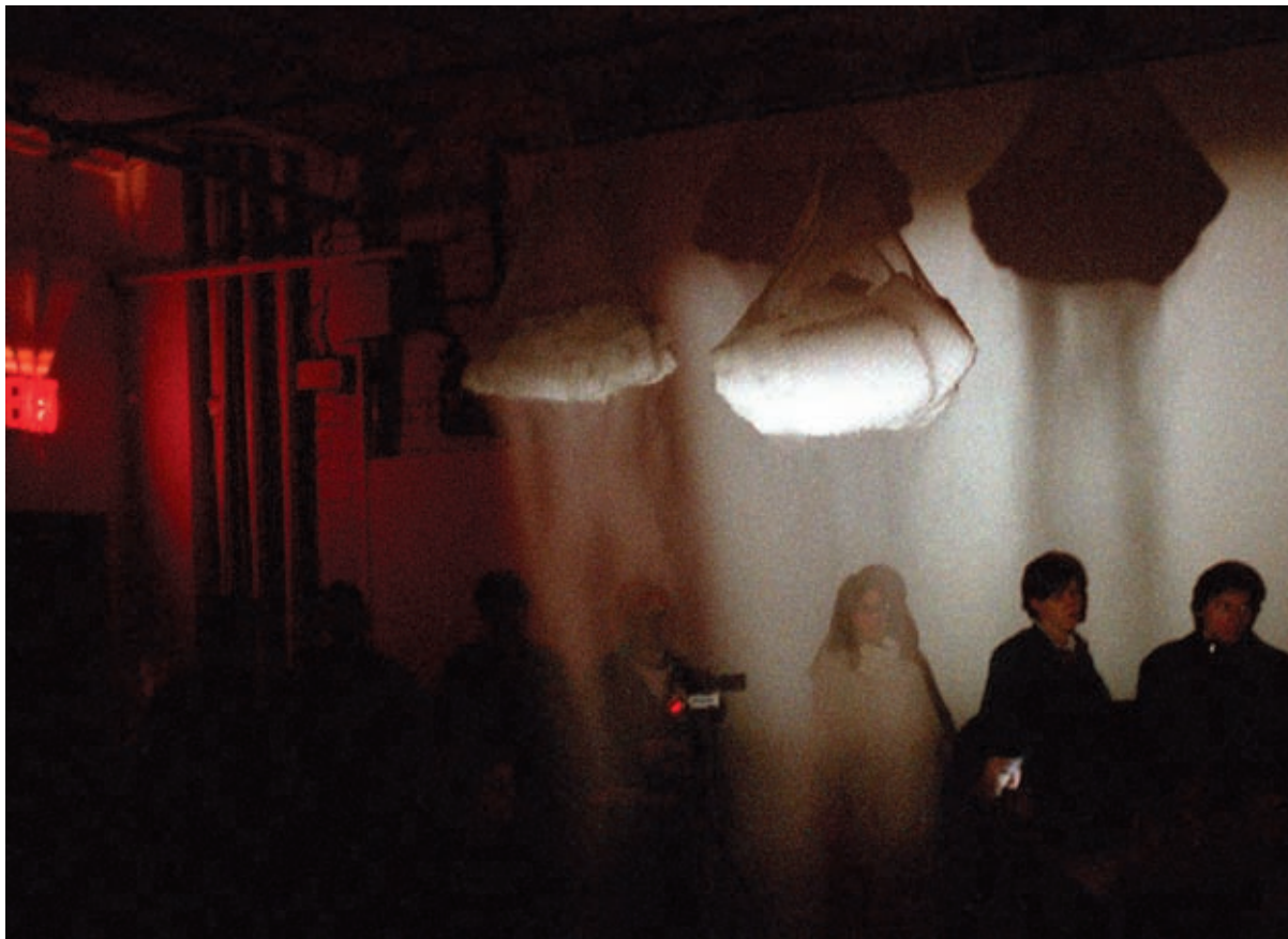
Two Hanks , 2003, Performance documentation / Photographies prises lors de la performance, Canada Gallery, New York, courtesy of / permission de Collection of the estate of the artist and Canada Gallery, New York