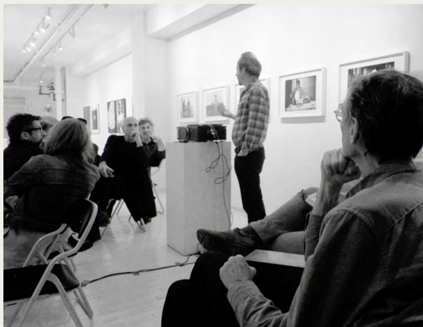
Projection du film / film projection John Max, un portrait de / from Michel Lamothe, octobre 2017

MJR: I think that La Castiglione has carved out a