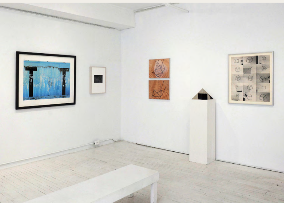
Exposition de groupe / group exhibition, Papier 2020, galerie / gallery La Castiglione, 2020