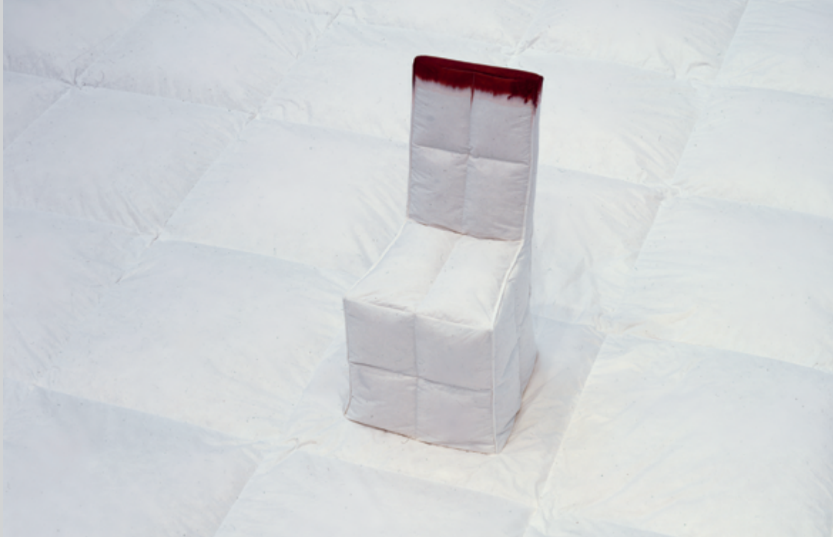
blood on the snow , 2002, teinture pour tissu, coton, plumes et chaise, 107 × 610 × 610 cm, collection de la Mendel Art Gallery au Remai Modern, photo : Howard Ursuliak/Morris and Helen Belkin Art Gallery

Juste avant les pièces principales de l'exposition, The Name and the Unnamed (2002) donne le ton de la visite. L'installation vidéo témoigne de la performance Vigil réalisée en 2002 en hommage aux femmes autochtones disparues dans un quartier de Vancouver. Dix-sept ans plus tard, l'œuvre continue de résonner avec l'actualité alors que les conclusions de l'Enquête nationale sur les femmes et les filles autochtones disparues et assassinées ont été rendues publiques. Le nom des femmes clamé par Belmore continue de retentir aux oreilles lorsque l'on découvre, en pénétrant dans la première salle de l'exposition, la photographie grand format Sister (2010), imprimée sur transparent et rétroéclairée, qui semble flotter sur le mur du fond. Les bras en croix comme si elle