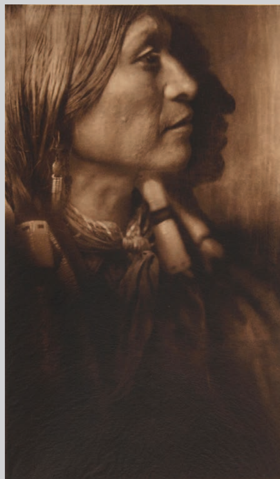
Vash Gon – Jicarilla , 1904, photogravure sur papier japonais Gampi, Musée McCord

Edward S. Curtis fut influencé en son temps par le « pictorialisme » (1885-1915), un mouvement lié à l'usage de ce nouveau procédé dit « à plaque sèche » et aux manipulations (retouches, filtres et papiers spéciaux) autorisées afin de rapprocher la photographie de l'art de la peinture et de l'eau-forte. Le Camera Club de New York (1896) et le photographe Alfred Stieglitz en sont des références américaines. Néanmoins, malgré les mises en scène paysagistes et les portraits de nombre d'Amérindiens costumés, c'est davantage