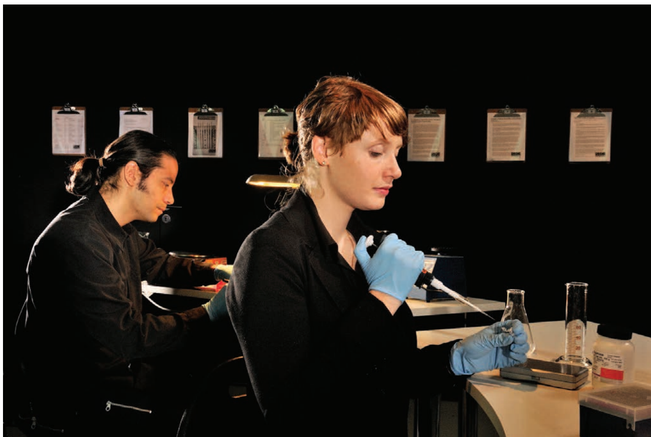
PAGES 35 À 40 : Suspect Inversion Center (SIC) , 2011, installation-performance, présentée dans le cadre de l'exposition / shown in the exhibition Fingerprints... Index - Imprint - Trace , sous le commissariat de / curated by Jens Hauser, dans l'Espace projet de la Fondation Ernst Schering / in the Project Space of the Ernst Schering Foundation, Berlin, photos : Axel Heise