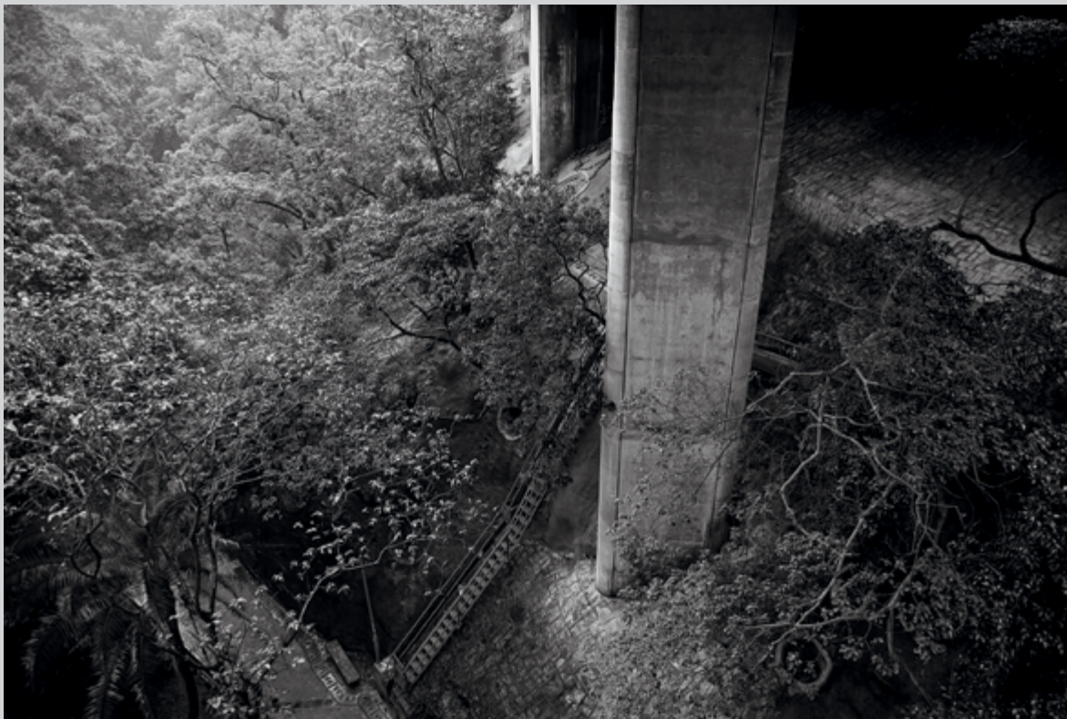
Sans titre, de la série Les lieux suspendus , 2013-2017, impression numérique sur papier chiffon, 86 × 122 cm