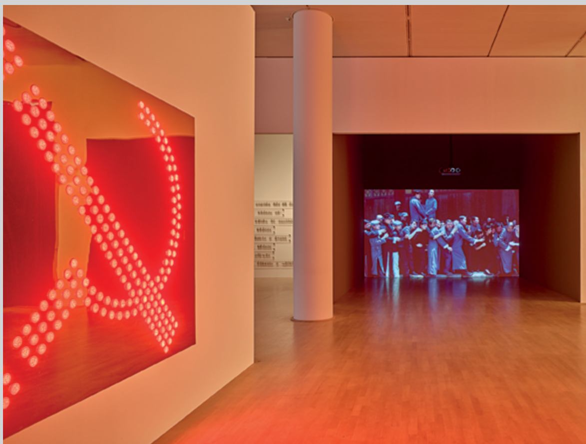
Marks , 2011, installation lumineuse sur panneau plastifié, 185 x 244 cm ; Re-Run , 2013, vidéo en boucle, 8 min

comportant également une véritable profondeur spirituelle.