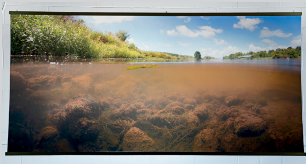
Isabelle Hayeur, En eaux troubles

le registre de ces images relèverait davantage d'une forme de monologue intérieur. Elles proposent ici une variation appliquée à l'image de ce mode