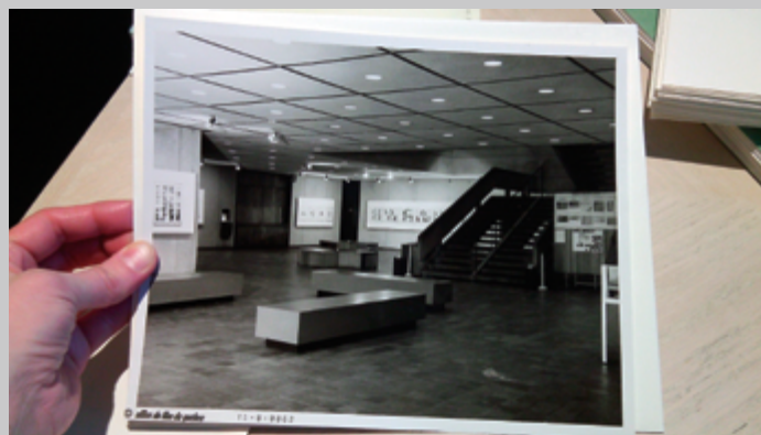
Préparation de l'exposition (avec Vue de l'exposition Dessins-photos 1970-1974, Musée d'art contemporain de Montréal, Cité du Havre, 1975)

jonchée de « grelots » bleus de différentes tailles, représentation trompant d'avance l'attente d'un accès privilégié par le médium à cette réalité qui s'offre déjà à nous dans toutes les dimensions de l'espace.