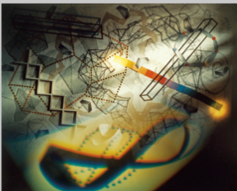
L'oblique piégée , 1988, épreuve couleur, 127 × 130 cm

tation controversée en son temps, mais sur laquelle le MAC renchérit avec Québec 75 , où Tousignant intégra l'appareil photographique dans la mise en scène magritte de Laissez faire les sphères . « REGARDEZ À L'INTÉRIEUR », enjoint un écriteau, mais sa visée ne montre qu'une diapositive de la salle