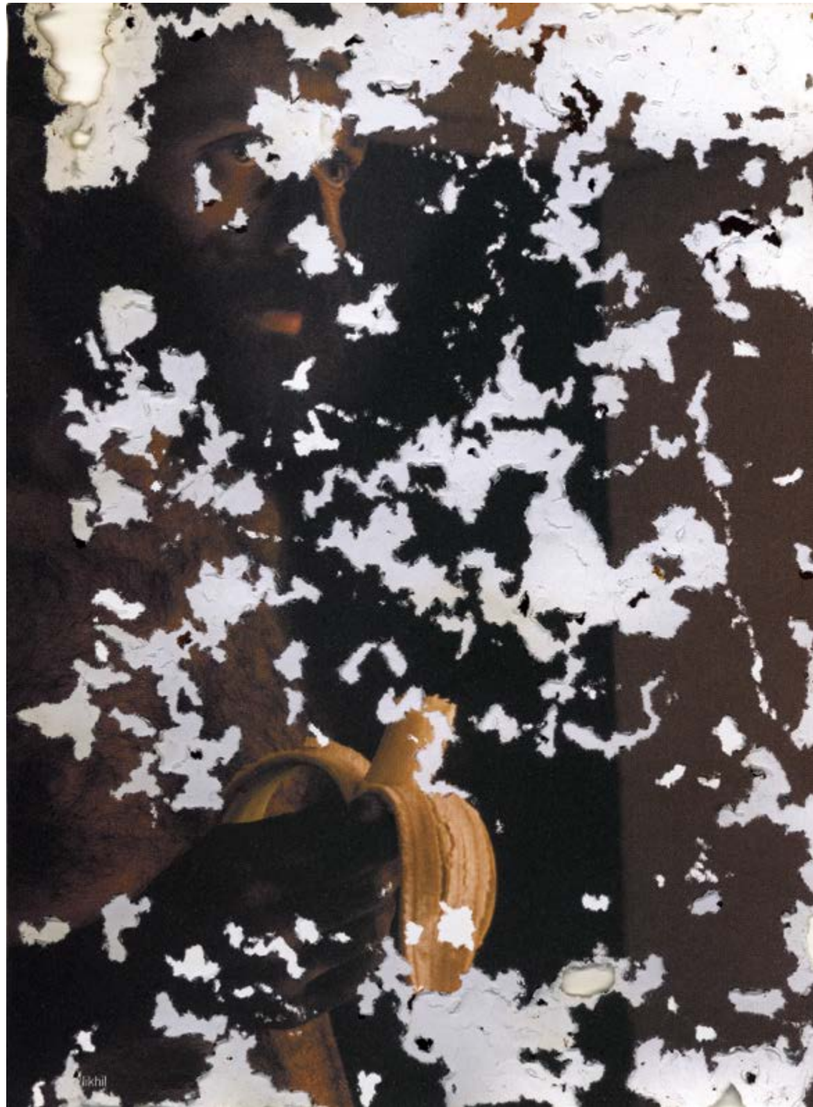
Joan Fontcuberta Trauma