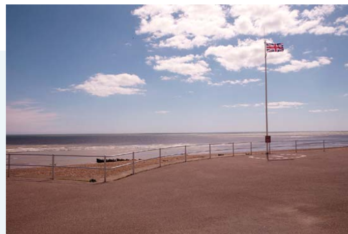
Emmanuelle Léonard image fixe tirée de / still image from Postcard from Bexhill-on-Sea, 2014 installation vidéo monobande avec son / single-channel video installation 15 min, voix / voices: Édith Paquet et / and Étienne Rouillard

Dans une certaine mesure, cette position a partie liée avec l'orientation éditoriale de la Biennale. Il n'y a pas si longtemps, on associait les enjeux sociaux qui se manifestaient dans le champ