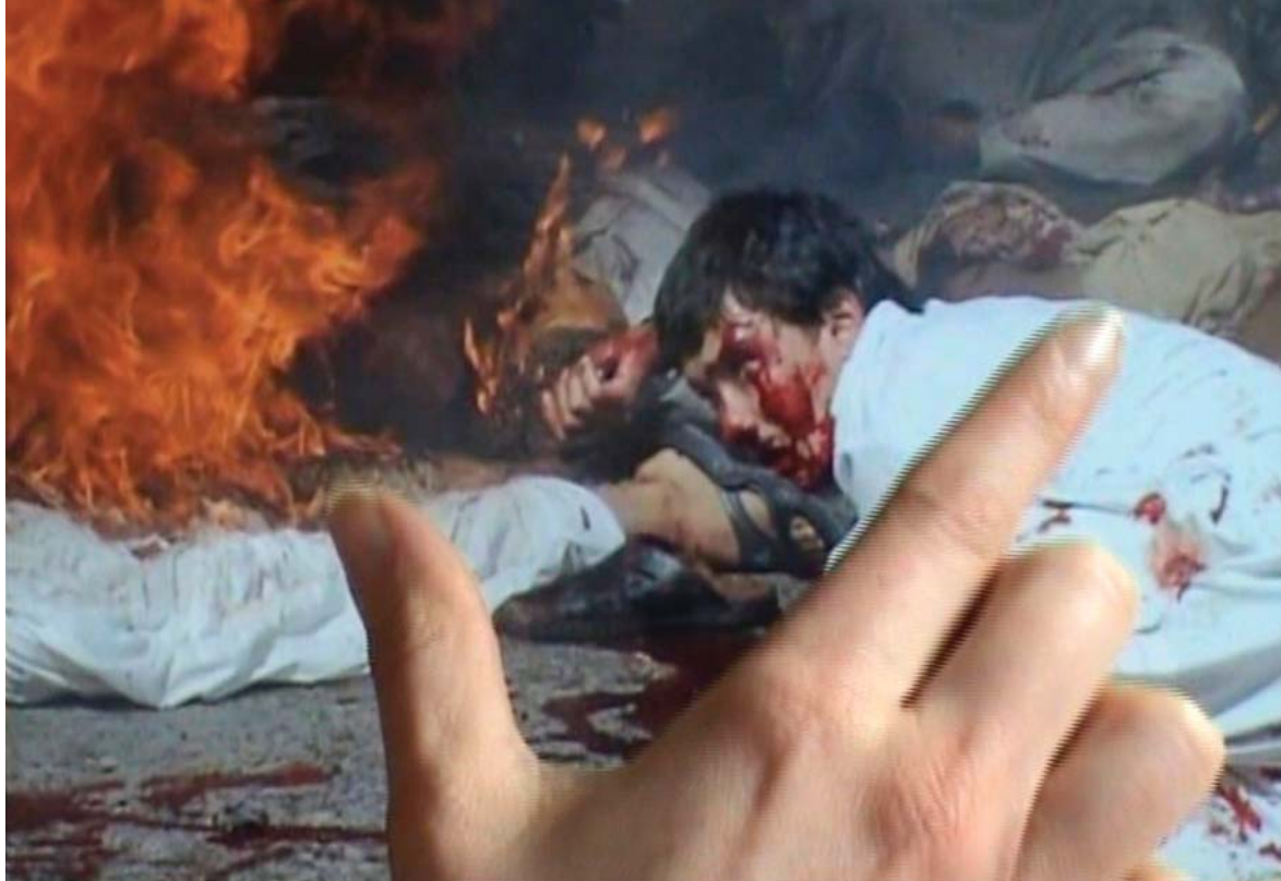
Thomas Hirschhorn Touching Reality , 2012 image fixe tirée d'une vidéo muette / still image from a silent video 5 min