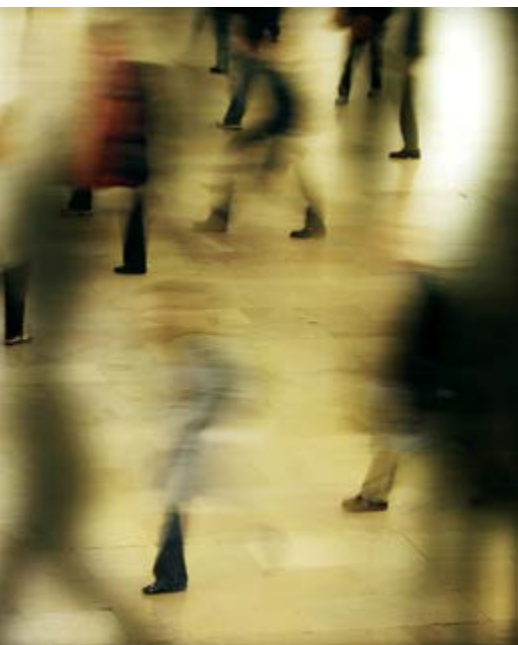
Sohei Nishino, Diorama Map Tokyo, 2004, 140 x 140 cm, courtesy of / permission de Michael Hoppen Contemporary

Le rôle fondamental de l'essai de Solnit dans la genèse de l'exposition est résumé par un passage de L'art de marcher , qui sert d'introduction au texte didactique d'Irvine. La citation fait également écho au caractère inclusif qui est symptomatique d'un tiers espace : « Ce mouvement et les vues qu'il découvre favorisent semble-t-il l'apparition d'objets qui occupent l'esprit, et c'est par là que la marche est une activité ambiguë et infiniment fertile : elle est en même temps un moyen et une fin, un voyage et une destination 4 . »