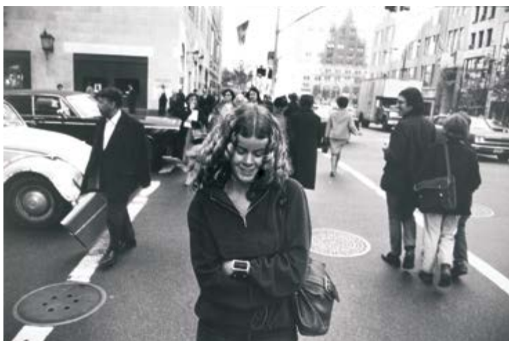
Garry Winogrand, Untitled , 1981, from the / du portfolio Women Are Beautiful Dorothea Lange, On the Street Relationships , 1951 (OMCA)