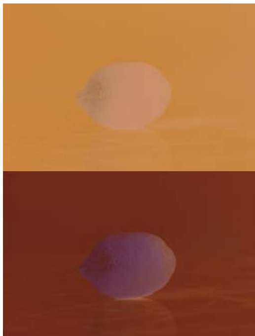
Lorna Bauer et Jon Knowles, Film/Unfilm , 2014, double projection de diapositives couleur / double projection of colour slides, 80 positifs / positive, 80 négatifs / negative

Through the double eclipse of Film/Unfilm , I sense this world in which the lemon and I are immersed. The distance that separated me from the lemon gradually fades away. Not being able to do better than Merleau-Ponty in trying to name this "mystery of passivity" 3 of vision, which seems to me to be the very intention of Bauer and Knowles, I will quote him again, and at length: "Visible and mobile, my body is a thing among things, it is one of them. It is caught in the fabric of the world, and its cohesion is that of a thing. But because it moves itself and sees, it holds things in a