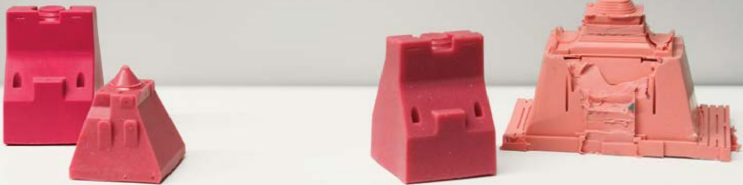
Jacinthe Lessard-L., Les chambres étalées (détail / detail), 2014

La chambre inversée, Les chambres étalées