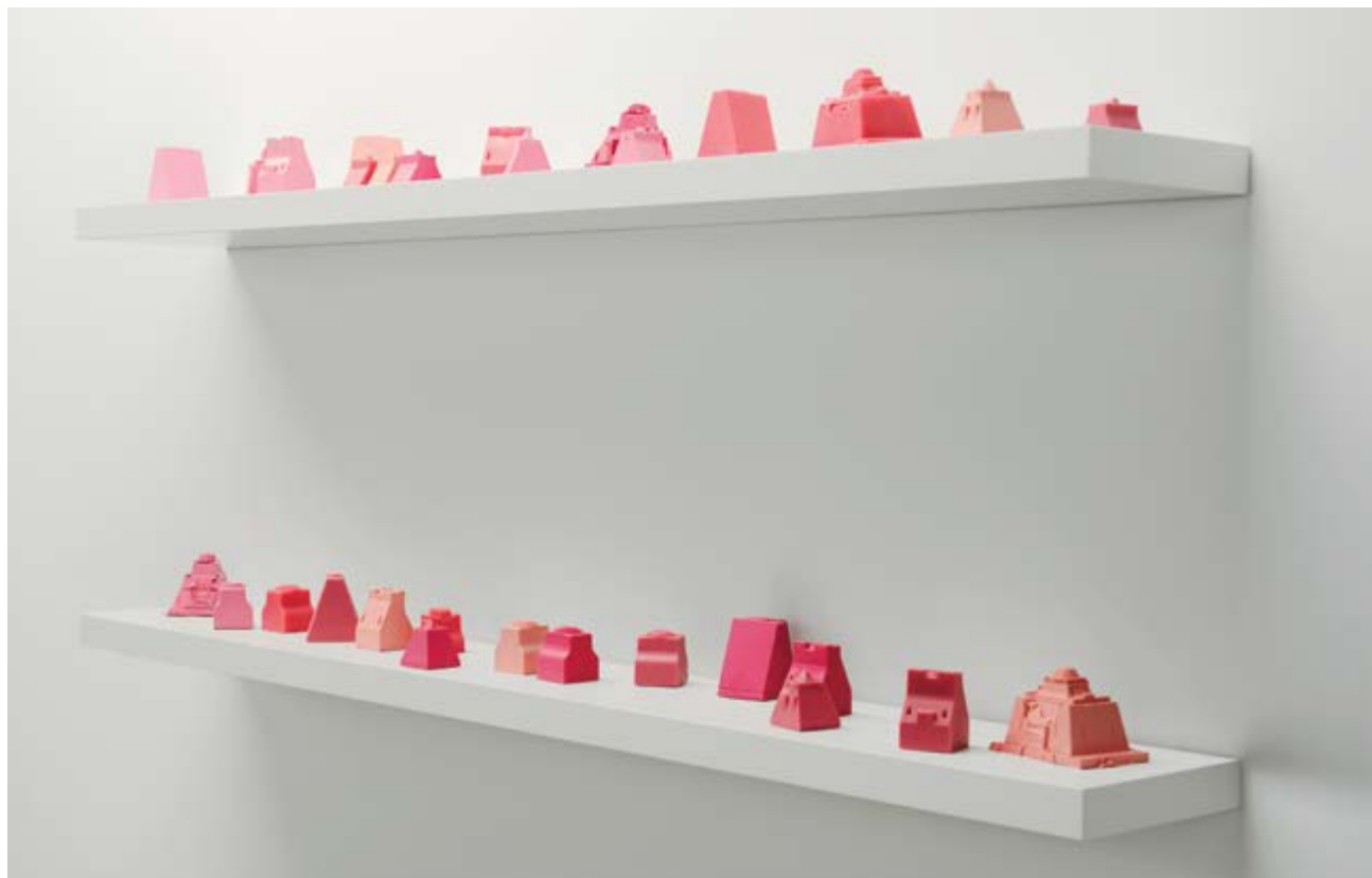
Jacinthe Lessard-L. , Les chambres étalées , 2014, 30 sculptures en silicone / 30 silicone sculptures, dimensions variées / various dimensions