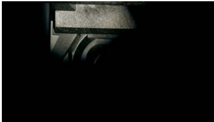
Jacinthe Lessard-L., La chambre inversée , 2013, installation vidéo / video installation, 8 min 38 s, en boucle / loop

the wheel, uses a wire to detach the bowl from the round platform, and starts the wheel again to perform a quick cleaning (the three-minute loop then begins over). Once again, distance and coldness are imposed: no context is given (the potter's face remains out of frame) and the action filmed leads to a very predictable conclusion. But, once again, the banality of the subject, the simplicity of the story, the choice of inexpressiveness, and the formal clarity encourage a contemplation interrupted by several epiphanies.