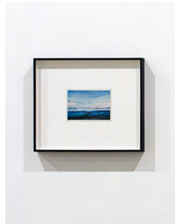
Salt (A Collection), Salt I-VII, Salt Crystals Balls I-III (details / détails), 2013-2014, found postcards, gouache and salted balls / cartes postales trouvées, gouache, boules de sel, 7 parts framed or in glass cases / 7 composantes encadrées ou sous vitrine, courtesy / permission Tacita Dean, Marian Goodman Gallery / galerie, Paris, New York

Great Salt Lake rose in the 1970s having now receded. The film plays out Dean's interest in extreme and unusual landscapes and incorporates images seemingly taken from Ballard's dystopian vision of once-futuristic machines now encountered as dysfunctional artefacts, wheels autonomously and gratuitously churning canals of sluggish salt and water. This uninhabited landscape is overlain with voice-over quotations by Smithson and Ballard, one of the more remarkable being Ballard's "Robert, I have to tell you. Even the sun is growing colder."