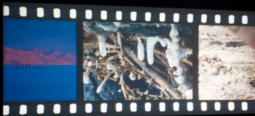
PAGES 61-62: Exhibition views / vues de l'exposition Tacita Dean: JG , 2014, Galerie Marian Goodman, Paris, courtesy / permission Tacita Dean, Marian Goodman Gallery / Galerie Marian Goodman, Paris, New York

Dean est surtout connue pour ses œuvres commémoratives réalisées sur film celluloïd 16 mm, ainsi que pour ses livres uniques rassemblant des photographies trouvées, tel le remarquable Floh (2001), qui met en valeur non seulement l’objet livre mais également la qualité non discriminatoire de la photographie.