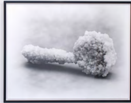
The Book End of Time and The Tail End of Film , 2013, b & w photographs on fibre-based paper / photos noir et blanc sur papier fibre, 123 x 159 cm unframed / sans le cadre, courtesy / permission Marian Goodman Gallery / Galerie Marian Goodman, Paris, New York

work are not only a nostalgia in which the subject is the past, but, more importantly, what she identifies as a future being lost in an ever-greater technological anomie. The evaluation that sidelines artists such as Stan Douglas, Eija-Liisa Ahtila, and Dean on the basis of their concern for recollection and memorialization is simply another demonstration of contemporary alienation. J. G. Ballard's focus on a past dystopian future echoes that of Kafka, who describes an autonomous technology, the dehumanized version of post-humanism in which the space of human lack is made up for by a culture machine that works by itself.