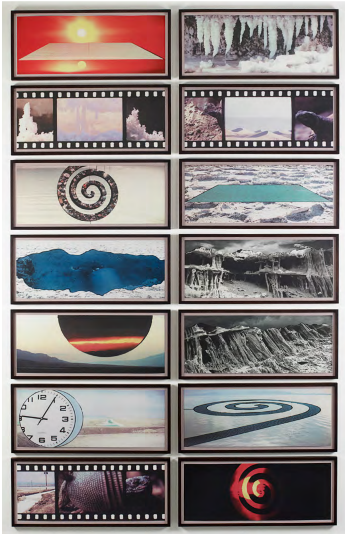
JG ( Offset ), 2013, 14 archival offset prints / 14 épreuves offset archive, 30 x 78 cm