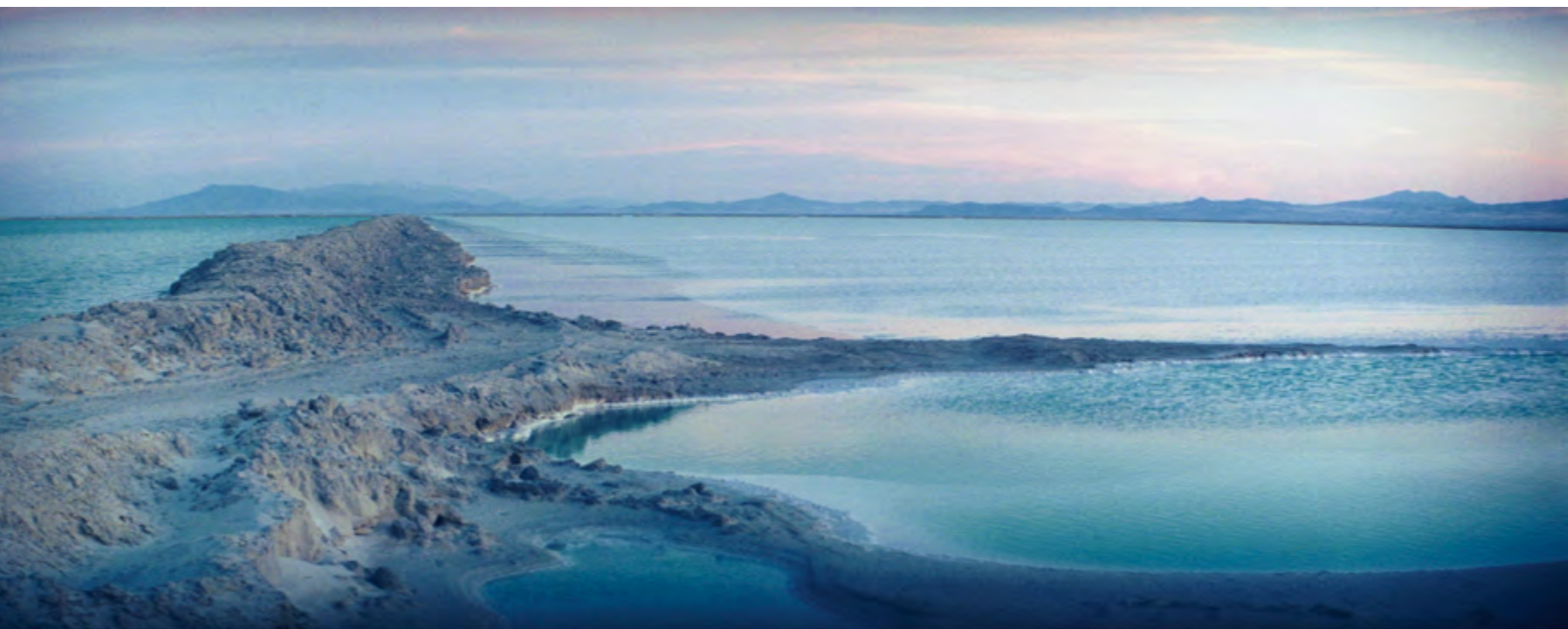
PAGES 64-65: JG, 2013, film stills / extraits, 35 mm color and black and white anamorphic film with optical sound, loop / film anamorphique 35 mm en couleur et noir et blanc avec son optique, en boucle, 26 min 30 s, courtesies / permission Tacita Dean, Marian Goodman Gallery / Galerie Marian Goodman, Paris, New York