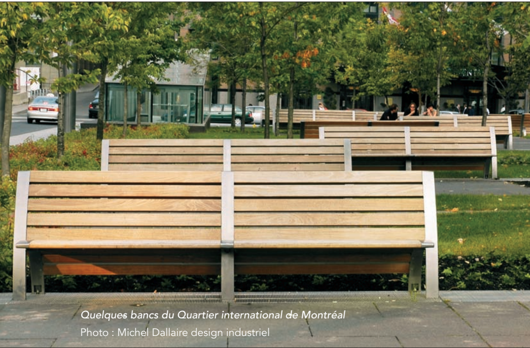
Quelques bancs du Quartier international de Montréal Photo : Michel Dallaire design industriel

Michel Dallaire, qui a notamment conçu le mobilier urbain du Quartier international de Montréal, le mobilier de la Grande Bibliothèque ainsi que le BIXI.