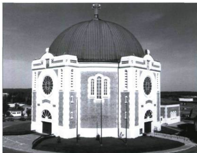
La cathédrale Sainte-Thérèse d'Avila à Amos.

Même si des travaux majeurs d'entretien du bâtiment avaient été réalisés en 1963, au milieu des années 1990, la dégradation du béton avait atteint un seuil critique. Une vaste campagne a alors été lancée par la Fondation Héritage de la cathédrale d'Amos afin de recueillir les 1,5 million de dollars nécessaires aux travaux de restauration et d'entretien subséquents. Une restauration minutieuse a pu ainsi être réalisée : les cadres de bois des fenêtres ont été remplacés, les portes et fenêtres ont été repeintes, la ceinture du dôme en cuivre a été solidifiée, la toiture en cuivre réparée et, enfin, le béton fissuré à plusieurs endroits a été refait. Grâce au partenariat du milieu et au soutien financier des gouvernements, les travaux extérieurs ont été achevés à la fin de septembre 1999.