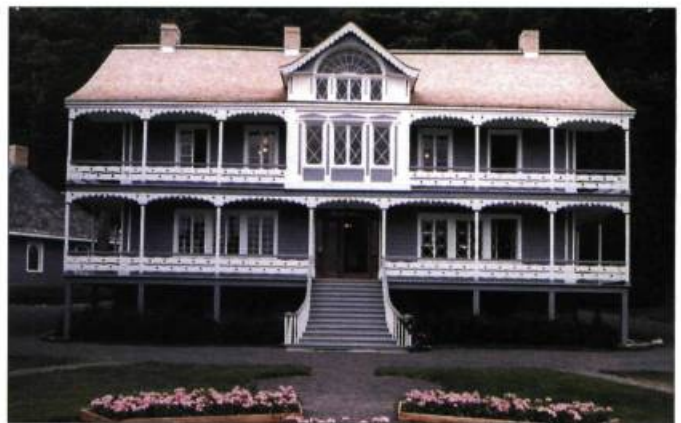
À l'été 1999, le manoir Joly-De Lotbinière restauré.

En 1967, le gouvernement du Québec acquiert le domaine, mais on doit attendre 1984 avant que des passionnés du milieu entreprennent les premières actions de sa mise en valeur. En 1991, les travaux de reconstitution des aménagements paysagers historiques sont entrepris et feront du Domaine Joly-De Lotbinière l'un des plus beaux jardins anciens du Québec. Deux campagnes de travaux successives (1992 et 1998-1999) permettent également de préserver et de protéger huit des dix bâtiments principaux du domaine. En 1998, le domaine devient la propriété de la Fondation du Domaine Joly-De Lotbinière, créée dans le but