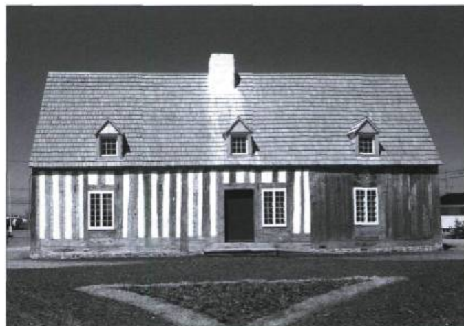
La maison Lamontagne à Rimouski.

Au début des années 1970, à la suite de l'intervention de Michel Lessard, le milieu entreprend des démarches pour conserver et mettre en valeur ce bijou d'architecture. Le colombage pierroté est alors dissimulé sous une couche de crépi, elle-même recouverte de planches verticales, puis de planches à clin et enfin d'un rang de bardeaux. Pour les propriétaires de l'époque, cette construction n'est qu'une cabane encombrante bonne pour la démolition.