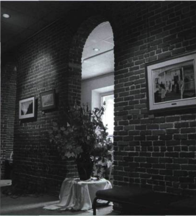
L'intérieur restauré du Vieux-Palais à Saint-Jérôme.

M ajestueux bâtiment de style néoclassique de l'école des Beaux-Arts de Paris, le palais de justice de Saint-Jérôme est inauguré en 1924. Il sert à cette fin jusqu'en 1970, année où l'institution judiciaire s'établit dans un nouvel édifice, rue Laviolette.