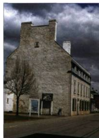
Le manoir de Tonnancour dans le Vieux-Trois-Rivières.

En 1966, l'édifice riche d'histoire est reconnu monument historique par le ministère des Affaires culturelles du Québec. En 1976, la Ville de Trois-Rivières l'achète et entreprend sa restauration en collaboration avec le Ministère. Les travaux sur le bâtiment ont donné le coup d'envoi d'une restauration plus globale de l'arrondissement historique de Trois-Rivières. Depuis 1981, le manoir de Tonnancour héberge la Galerie d'art du Parc. Ainsi, tout en découvrant un univers artistique contemporain et actuel, les visiteurs peuvent s'imprégner de l'atmosphère du bâtiment historique.