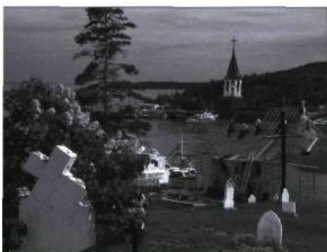
La chapelle de Tadoussac.