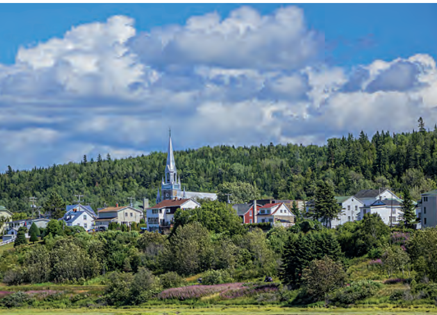
Au Bas-Saint-Laurent, Le Bic est protégé par un plan d'implantation et d'intégration architecturale visant à préserver la qualité et la diversité du cadre bâti.