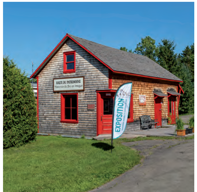
La Halte du patrimoine, un lieu de diffusion installé dans l'ancienne boucherie Blais, datant de 1915

Cela dit, le rôle du Comité en est aussi un de vigilance. Pour l'heure, ses membres sont préoccupés par le futur ensemble résidentiel du secteur Buntin. La première phase des travaux comprend notamment la construction d'un immeuble de