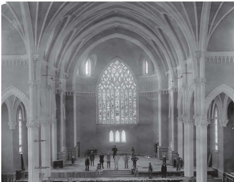
Intérieur de l'église de Sainte-Agnès à Lac-Mégantic, après l'installation de la verrière en 1913