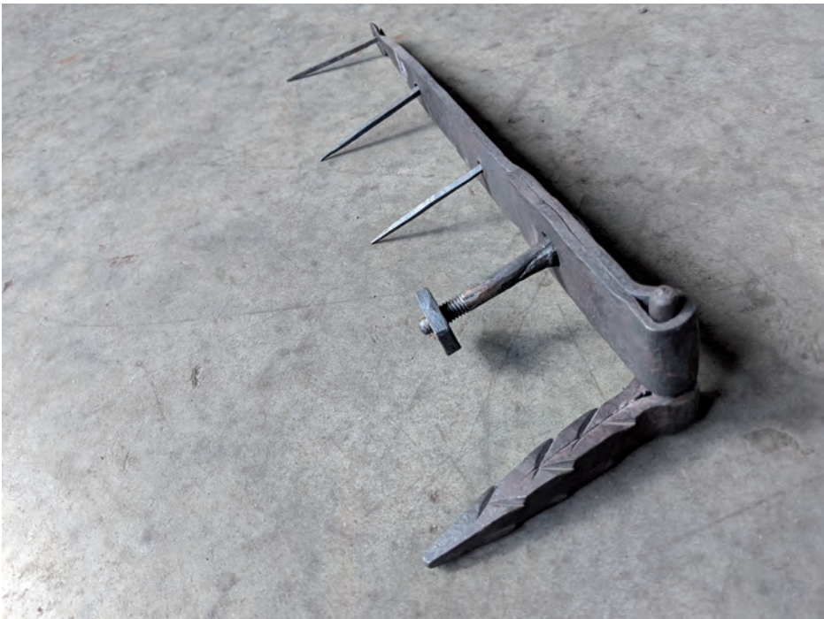
Reproduction de penture de porte traditionnelle en vieux fer. Cette pièce de quincaillerie a été réalisée comme support à la formation sur le sujet donnée en partenariat par Les Forges de Montréal et le Conseil des métiers d'art du Québec.