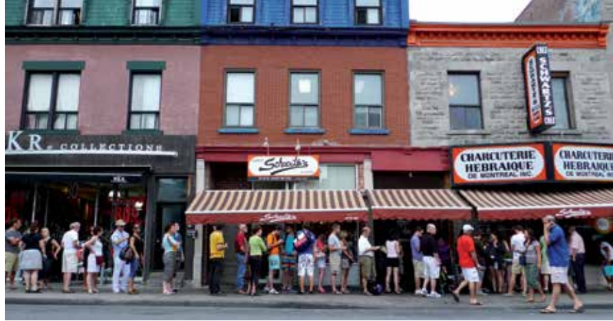
Issu de l'immigration juive d'Europe de l'Est, le smoked meat Schwartz's fait partie des incontournables montréalais.

Jeanne Corriveau est journaliste au quotidien Le Devoir .