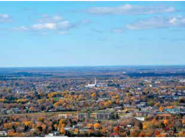
Du haut du mont Arthabaska, il est possible de repérer une vingtaine de clochers et, ainsi, de reconnaître les villages de la plaine.