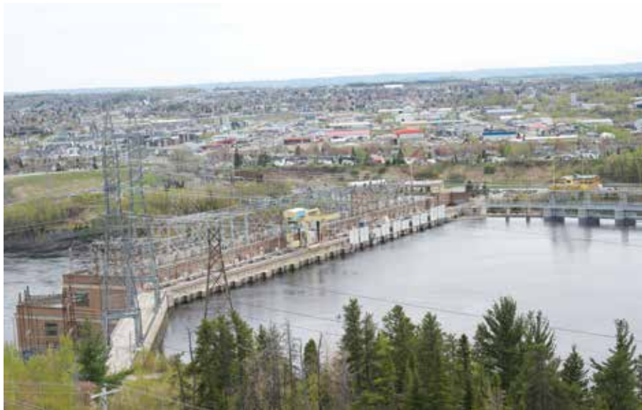
Le belvédère du château d'eau de l'île Maligne donne à voir la ville et les installations hydroélectriques qui ont marqué l'histoire industrielle du Saguenay-Lac-Saint-Jean.

cette voie royale. C'est le cas du belvédère Beaulieu à Saint-Simon ou de celui du cap Bon Ami dans le parc national Forillon. Leur position permet d'évaluer l'échelle des éléments du relief et l'ampleur des phénomènes géologiques et géomorphologiques qui ont façonné le territoire. Par exemple, le gigantesque travail des glaciers qui, en creusant de tout leur poids des dépressions antérieures, ont construit des vallées en auge typiques. On peut en admirer le résultat dans les hautes gorges de la rivière Malbaie, la vallée de la Jacques-Cartier ou le fjord du Saguenay, depuis l'Acropole des Draveurs, le sentier des Loups et le cap Jaseux à Saint-Fulgence, respectivement.