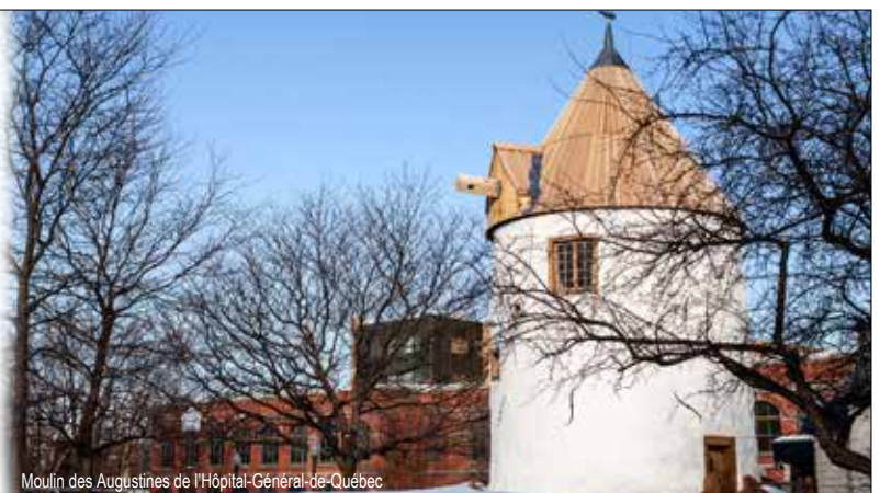
Moulin des Augustines de l'Hôpital-Général-de-Québec

810, Saint-Joseph Est Québec Québec Canada G1K 3C9 t. (418) 694. 6911 f. (418) 694. 0833 www.bfharchitectes.com