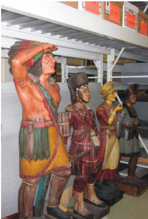
Coup d'œil aux réserves du Musée Stewart, situées au Centre des collections muséales à Montréal. On y trouve des artefacts témoignant de l'influence des civilisations européennes en Nouvelle-France et en Amérique.