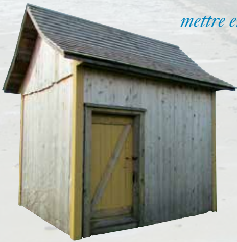
Laiterie datant de 1875 à Saint-André

L'inventaire des petits patrimoines, choisis en fonction de leur représentation dans le milieu et dans l'histoire des municipalités, a permis d'identifier les formes courantes