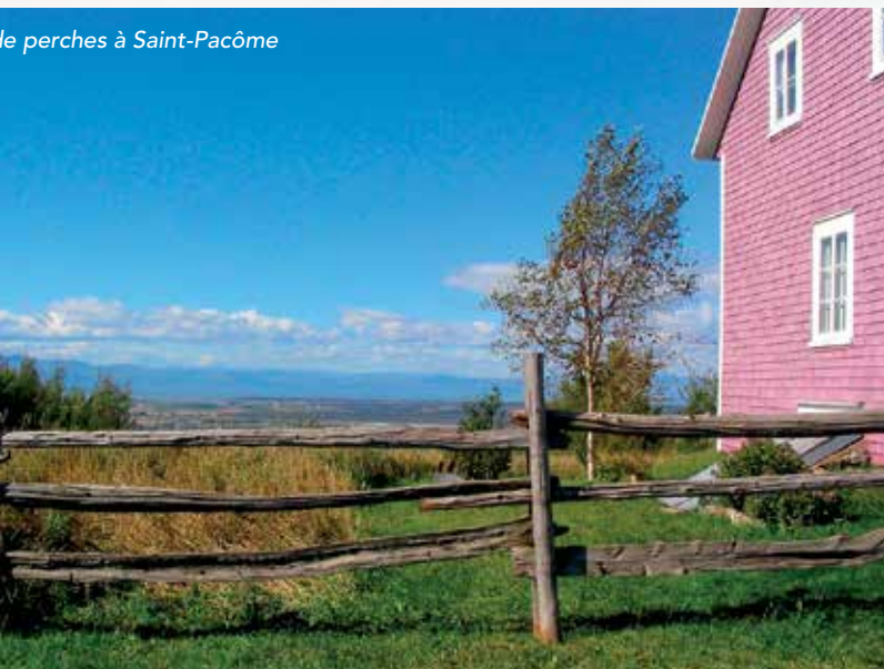
le perches à Saint-Pacôme