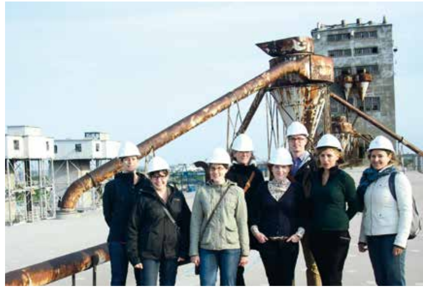
Visite du Silo n° 5 organisée pour les guides bénévoles en 2012

Le climat économique a également une incidence sur le recrutement. Dans un contexte où les emplois se font plus rares, l'action bénévole représente pour les nouveaux diplômés une façon d'acquérir des expériences professionnelles. Par exemple, les visites du Silo n° 5 du Vieux-Port de Montréal, organisées de 2010 à 2012 en collaboration avec la Société immobilière du Canada, ont attiré un nombre record de participants, mais aussi de jeunes guides bénévoles. Le côté «tripatif», inusité et interdit de la visite de cet ancien élévateur à grain explique sûrement l'engouement. Plus d'une cinquantaine de guides et accompagnateurs ont pu sensibiliser les visiteurs à la valeur patrimoniale et à l'avenir du silo.