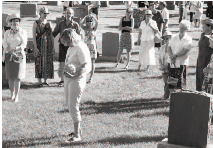
En 2005, l'artiste Karen Trask a réalisé une performance qui prenait sa source au cimetière de Deschambault.

initiatives originales en matière culturelle et patrimoniale sont un élément distinctif depuis plusieurs années. En 2005, à l'occasion de la Biennale internationale du lin de Portneuf, un événement auquel collabore Culture et patrimoine Deschambault-Grondines, l'artiste en résidence Karen Trask crée une œuvre, Lieu de contemplation , en s'inspirant des noms inscrits sur les pierres tombales du cimetière. Ces noms listés sur un ruban de papier de lin roulé en balle sont ensuite récités lors d'une lente et longue déambulation-récitation depuis le cimetière jusqu'au Vieux Presbytère, face au fleuve qui a vu vivre les ancêtres nommés. Émouvant. En 2008, l'artiste Colette Matte utilise, comme support à son œuvre Ligne de vie , la balustrade en fonte du cimetière. Des petites pièces de vitrail, entre lesquelles s'insèrent des phrases écrites par la population sur le thème du fleuve, s'éclairent selon les volontés du soleil. Cette œuvre sera réinstallée à l'été 2012 sur une clôture identique à Saint-Augustin-de-Desmaures.