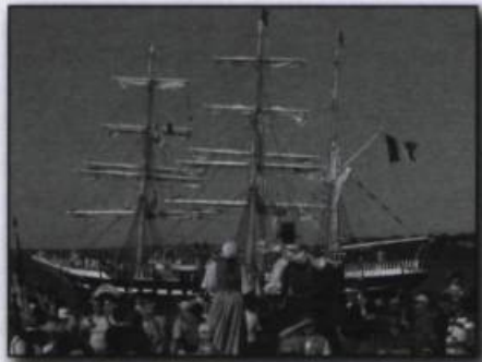
Arrivée du plus vieux trois-mâts français, le Belem , le 2 juillet 2008, dans le port de Québec. (Archives du consulat général de France à Québec).

La présence française au Québec est susceptible de s'accroître, à la suite de la signature par le président de