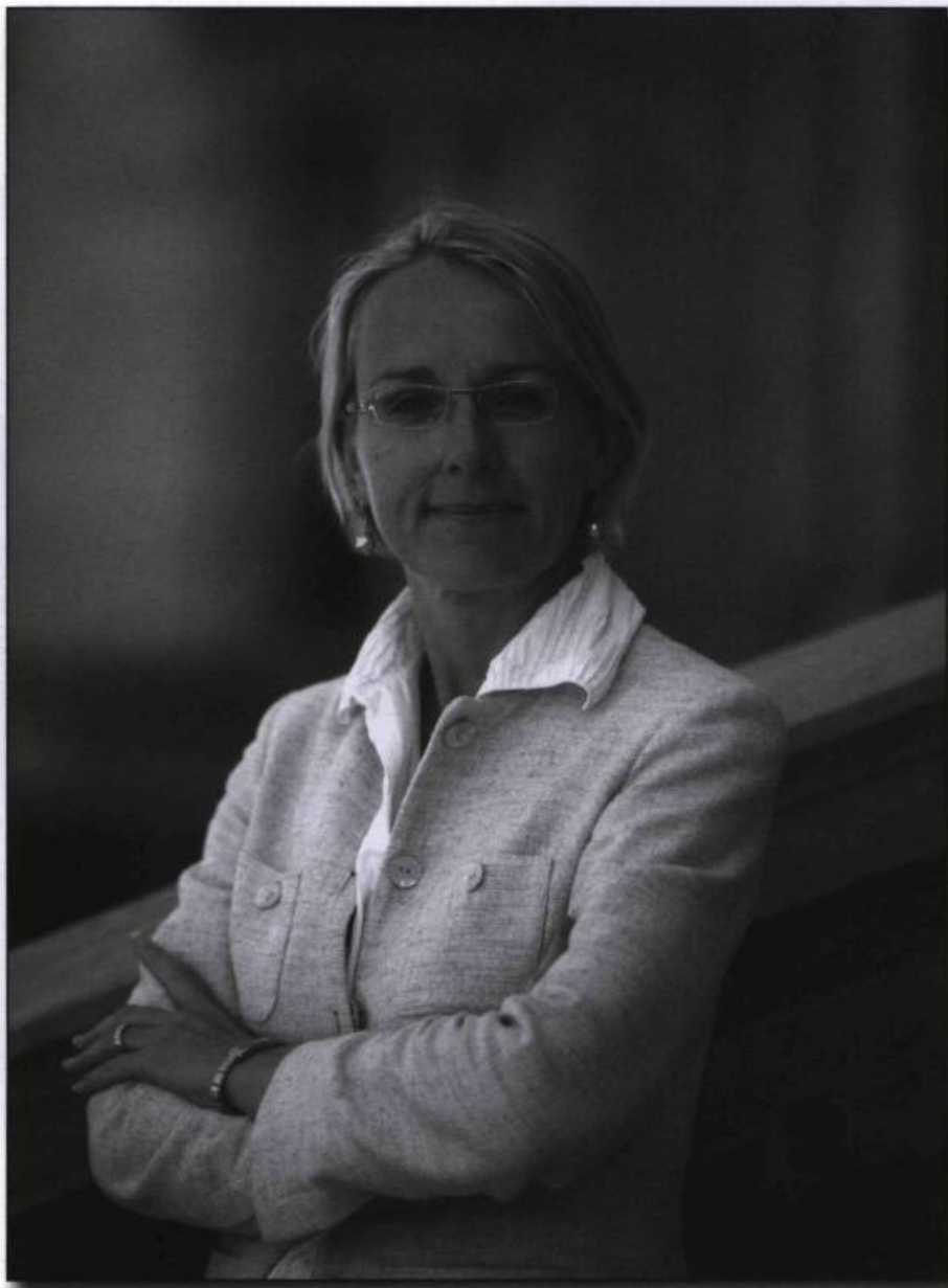
Hélène Le Gal, nommée consul général de France à Québec en juillet 2009. Elle est la première femme à occuper cette fonction en 150 ans d'histoire.

Le domaine culturel constitue une des dimensions les plus fécondes et les plus dynamiques de la coopération, à la fois dans les arts de la scène, de la chanson, de la littérature ou encore du cinéma. Les collaborations entre créateurs, organismes et entreprises se multiplient. La relation entre le Québec et la France s'est révélée être un moteur important pour la promotion de la diversité culturelle. À l'occasion du 400 e anniversaire de