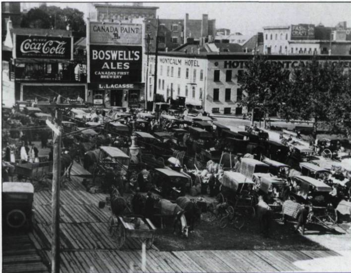
La halle du Marché avant la construction du Palais Montcalm. On aperçoit à l'arrière l'hôtel Montcalm qui fait face au Y.M.C.A..