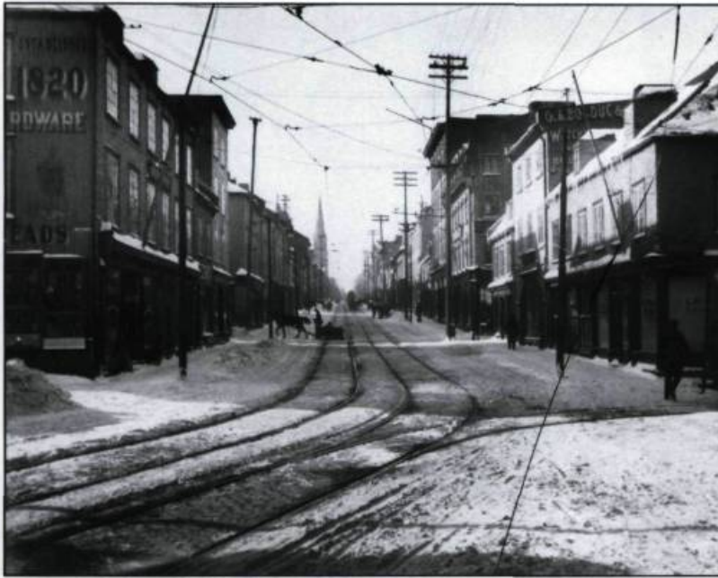
La rue Saint-Jean vers 1905.