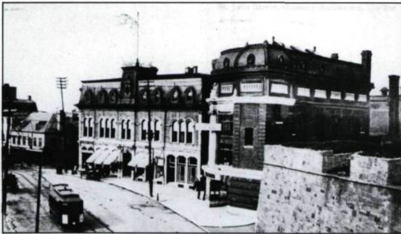
L'auditorium, en 1908, où de nombreuses vedettes internationales se produisent. (Carte postale: Valentine and Sons, collection Yves Beaugregard).

suspendus dans le vide, s'affairer aux réparations des tramways défectueux.