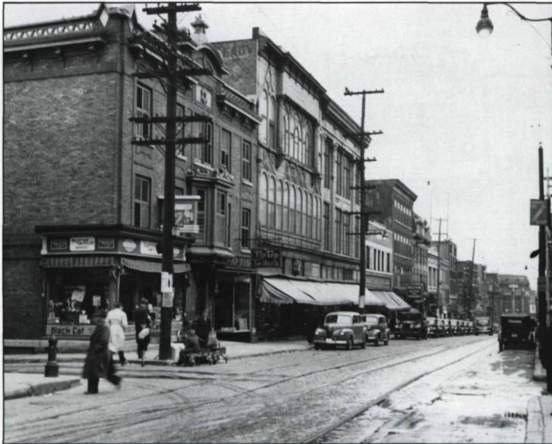
Animation sur la rue Saint-Jean. (Archives de la ville de Québec).