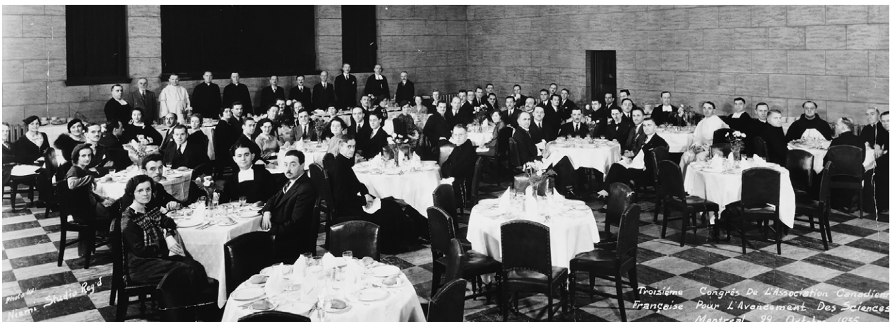
Souper du 3 e congrès de l'Acfas à Montréal, 1935. (Archives de l'Acfas).