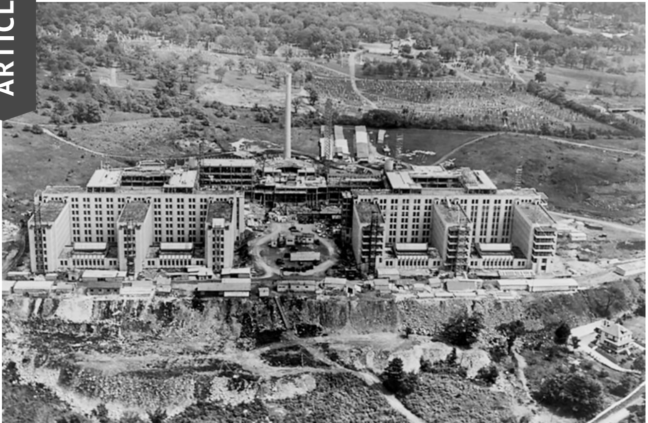
Chantier du nouveau pavillon de l'Université de Montréal, interrompu en 1931 et repris en 1941.