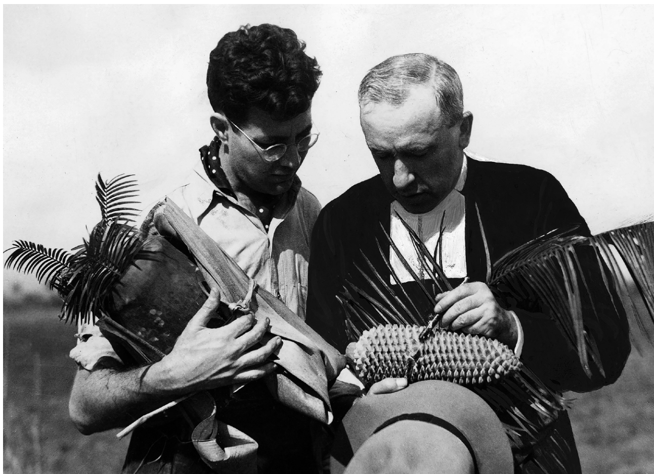
Marie-Victorin lors d'un séjour botanique à Cuba, 1939.

de financement des projets de recherche menés dans les universités québécoises, à l'image du Conseil national de recherches du Canada (il ne rencontrera toutefois pas le même succès que ce dernier). L'année suivante, sous l'influence de Marie-Victorin, le gouvernement présente une loi « pourvoyant à l'établissement à Québec d'une école des mines, de géologie et de métallurgie », à l'Université Laval.