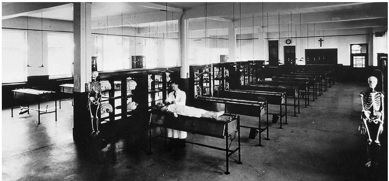
Salle de dissection à la Faculté de médecine de l'Université Laval, 1930.

En l'absence d'une élite scientifique rompue à la recherche, les universités et le gouvernement du Québec voient deux possibilités s'offrir à eux : recruter des professeurs étrangers qui viendront implanter cette pratique dans les universités québécoises francophones, ou alors financer les études supérieures des étudiants québécois les plus prometteurs dans des universités européennes et américaines, afin qu'ils développent des aptitudes de chercheurs et reviennent au pays les mettre en pratique, pour former à leur tour des chercheurs. Les deux voies seront empruntées. À partir du milieu