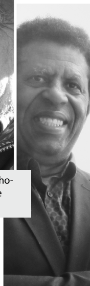
Dany Laferrière.