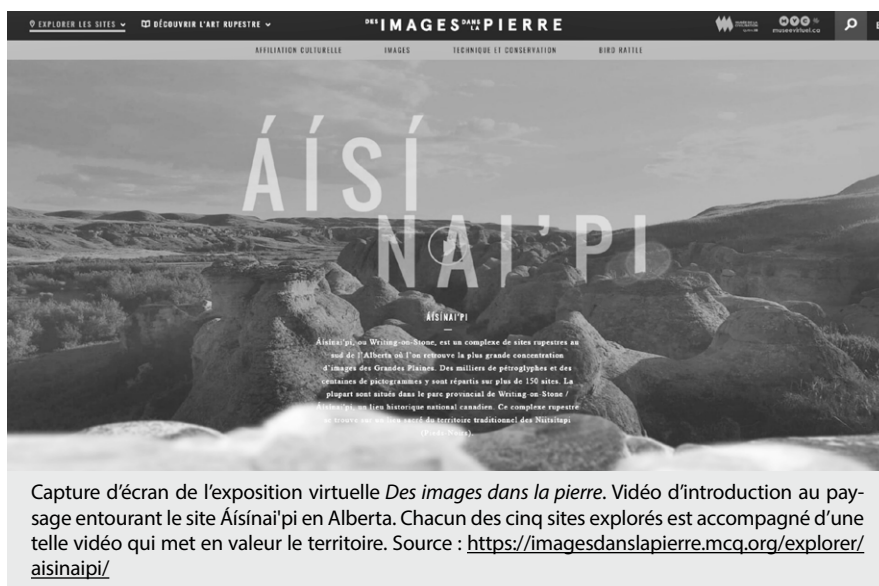
Capture d'écran de l'exposition virtuelle Des images dans la pierre . Vidéo d'introduction au paysage entourant le site Áísina'ipi en Alberta. Chacun des cinq sites explorés est accompagné d'une telle vidéo qui met en valeur le territoire.

des collectivités pendant des millénaires. Sur le plan symbolique, la terre est ainsi vue comme une mère nourricière.