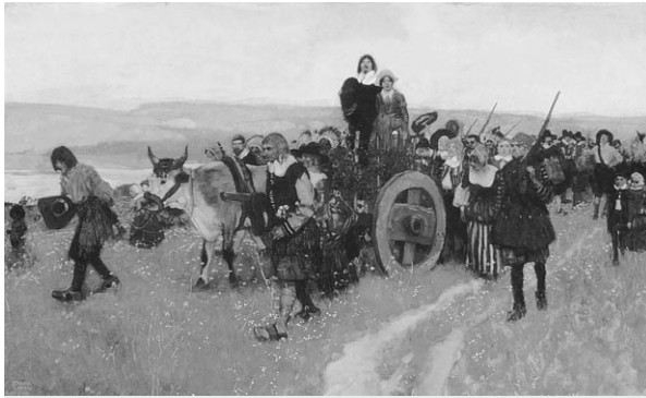
Arrival of Madame Champlain at Quebec 1620. Reproduction d'une huile sur toile de Frank Craig peinte en 1909.