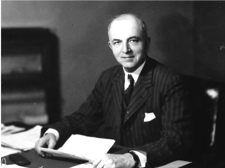
Cyrille Vaillancourt (1892-1969), en 1946.