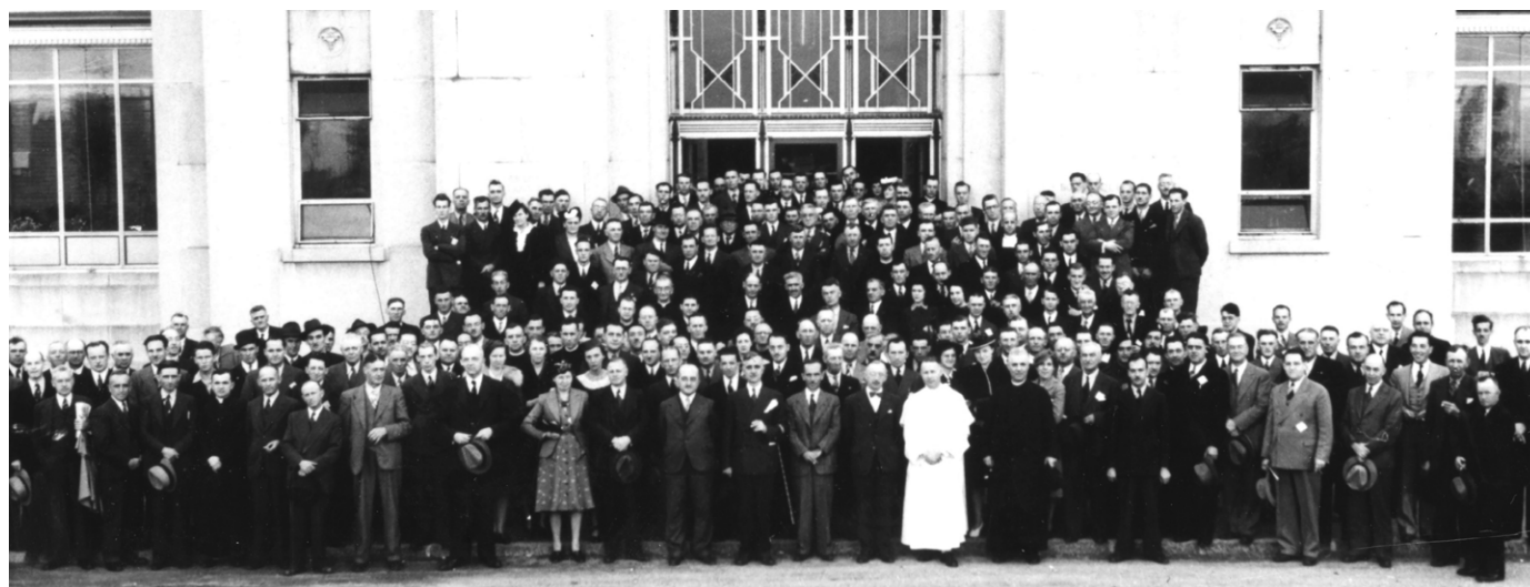
Participants à l'un des premiers congrès généraux des coopérateurs tenu au Jardin botanique de Montréal au début des années 1940.