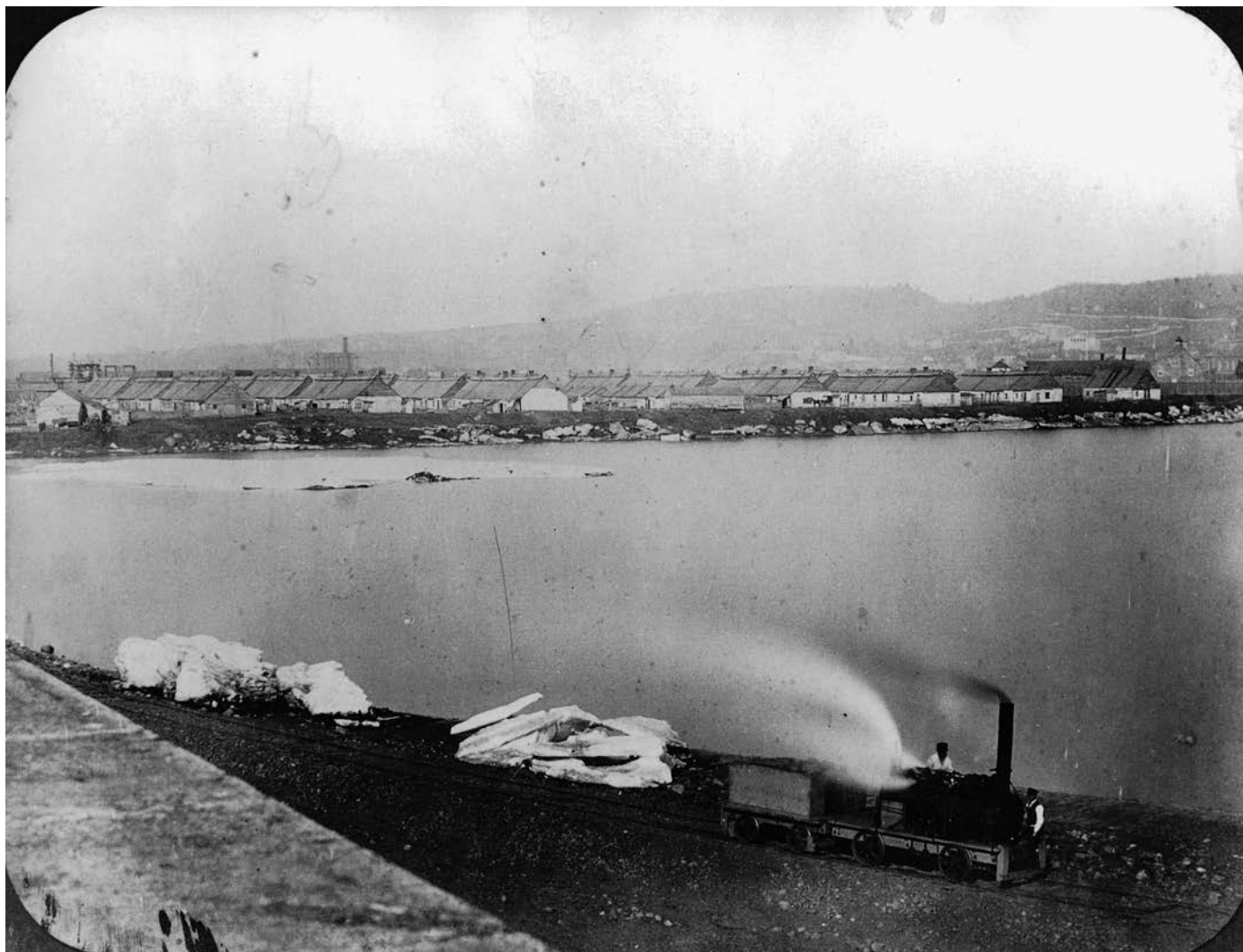
Sheds de Pointe-Saint-Charles depuis le haut du pont Victoria, Montréal, Qc, 1858-1859.

dais fuyaient la grande famine, qui touchait leur pays d'origine depuis 1845. Les mauvaises conditions de traversée dans les voiliers et le pou de corps, vecteur de la maladie, ont contribué à transporter une épidémie de typhus au Canada-Uni. Cette maladie, caracté-