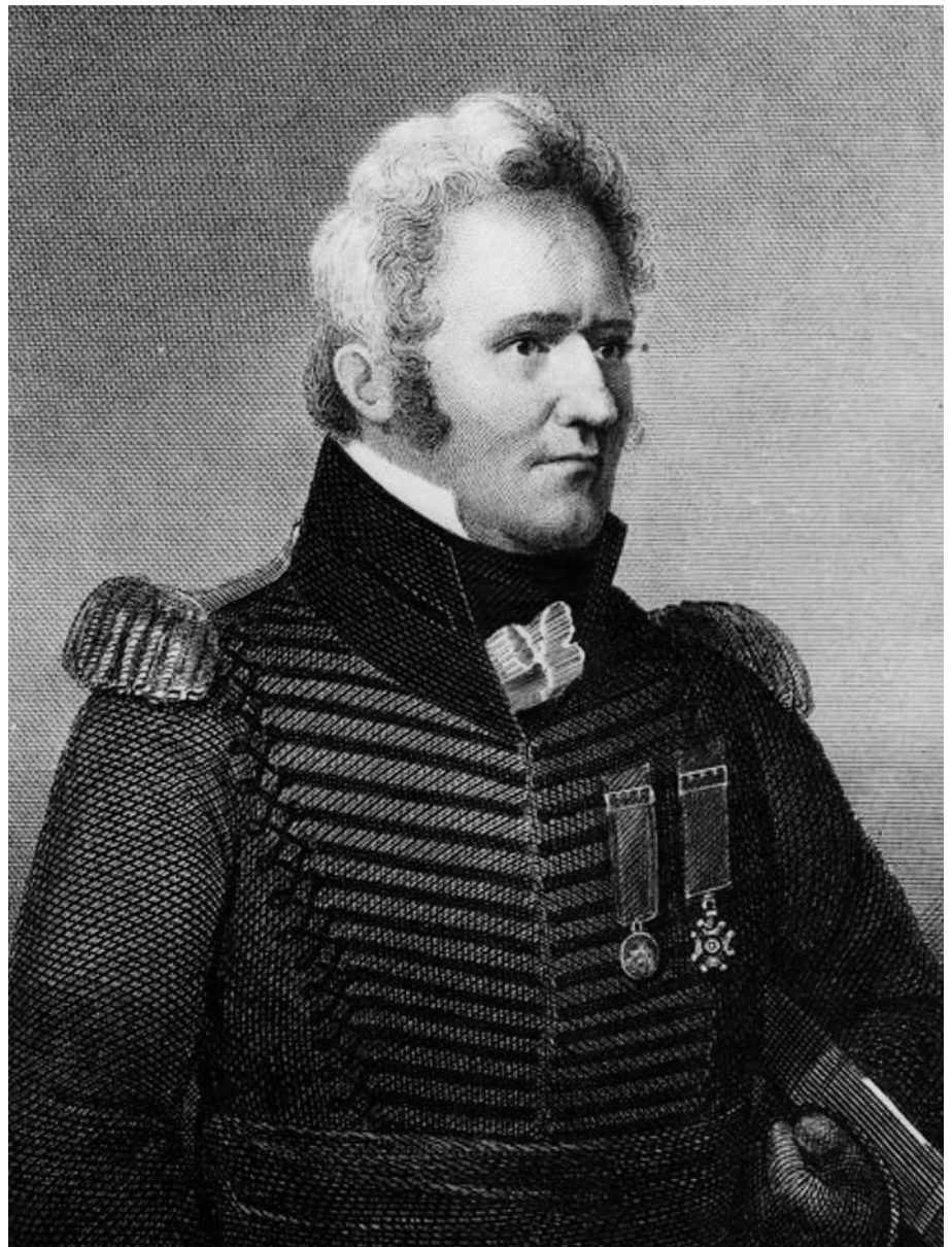
Charles-Michel d'Irumberry de Salaberry (1778-1829). Il a mis sur pied le corps provincial d'infanterie légère (les Voltigeurs canadiens), en 1812, et il a acquis une renommée durable au Canada lorsque 300 à 400 de ses hommes ont vaincu une force de plus de 5 000 Américains à Châteauguay, le 26 novembre 1813.