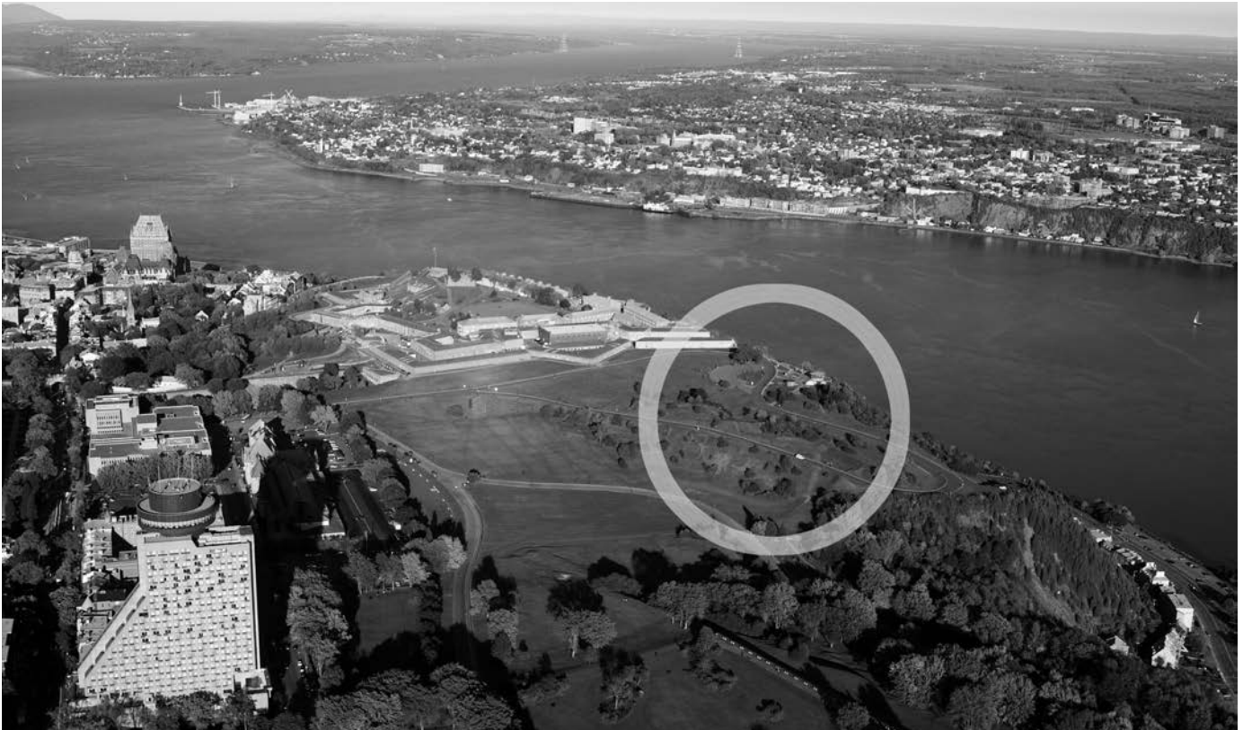
Vestiges des travaux de la citadelle temporaire.

du système de défense militaire du Canada, contribuant notamment à l'amélioration de son système de fortifications;