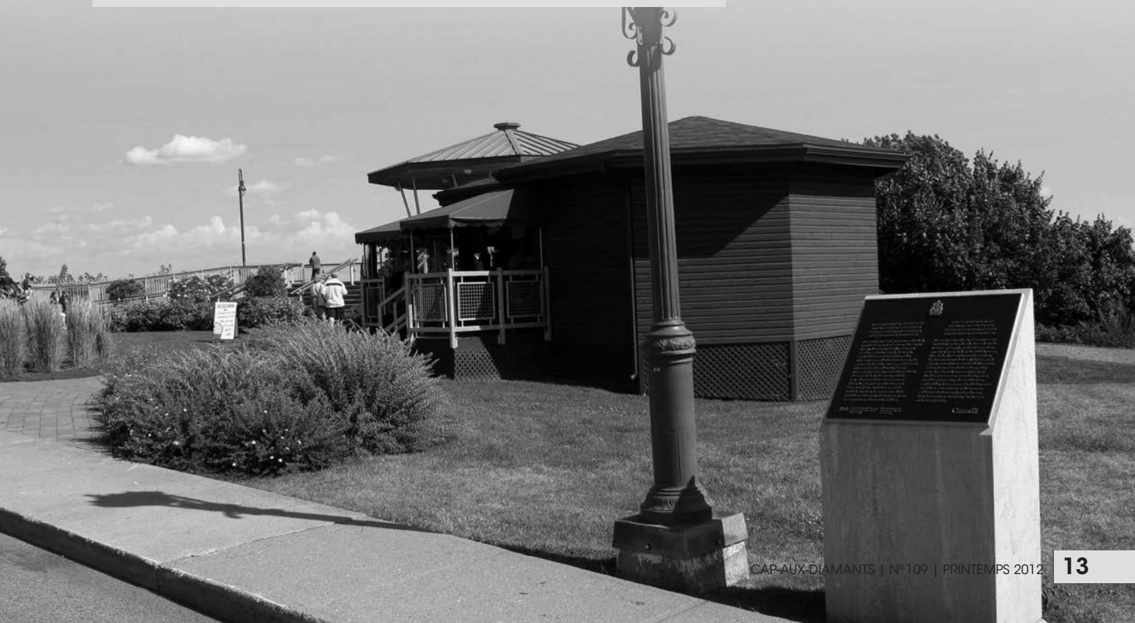
Emplacement de la plaque dévoilée en 2009, dans le parc des Champs-de-Bataille, à Québec.

« La contribution des troupes allemandes à la défense du Canada pendant la guerre de l'Indépendance américaine » fut désignée événement historique national pour les trois raisons suivantes : 1- cette grande formation de troupes qualifiées, qu'on estime avoir constitué le tiers des effectifs militaires britanniques au Canada en juin 1776, et la moitié au moins d'entre eux de 1777 environ à 1781, a permis aux Britanniques de reprendre les territoires conquis par les rebelles américains en 1775. En 1777, ces troupes allemandes ont participé à la tentative d'invasion du territoire américain dirigée par le général John Burgoyne; 2- après 1778 et jusqu'à leur démobilisation, en 1783, les troupes allemandes ont formé une composante essentielle