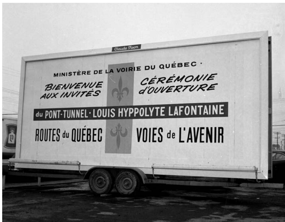
Cérémonie d'ouverture du pont-tunnel Louis-Hippolyte-La Fontaine. Adrien Hubert, 1967. (Bibliothèque et Archives nationales du Québec. E6S7SS1D670571).

La région de Montréal, pour sa part, compte aussi d'importantes infrastruc- tures dont la désignation rappelle le souvenir de personnages historiques. L'auto- route Ville-Marie porte le numé- ro 720 et s'étend sur près de 9 km, de l'échangeur Turcot jusqu'à la hauteur du pont Jacques-Cartier. Sa désignation