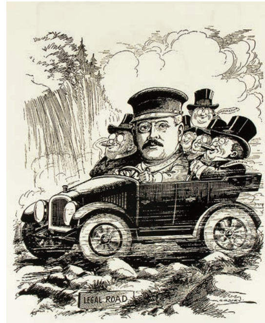
HON. JOSEPH LEONIDE PERRON, K.C., M.L.C.

Cette délégation de responsabilités du ministère de la Voirie en matière de tourisme doit cependant être mise en contexte. Entre 1930 et 1945, l'élan de développement du tourisme itinérant et des vastes travaux routiers est freiné coup sur coup par la crise économique et par la Deuxième Guerre mondiale. Dans un premier temps, au Québec comme ailleurs au Canada, la crise provoque l'arrêt des grands chantiers de construction routière. Le budget d'entretien des chemins est même réduit presque partout. Les initiatives du ministère de la Voirie en matière de tourisme deviennent de plus en plus limitées.