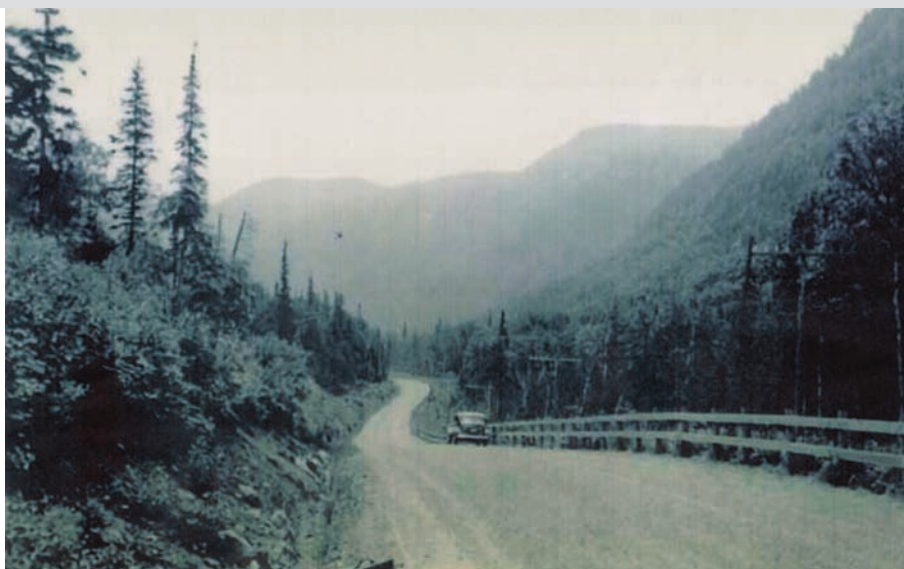
La route 54 dans le parc des Laurentides. (Fonds de photographie Studio Chabot. Archives du ministère des Transports du Québec).

Derrière cette modernisation du réseau routier québécois, une nouvelle réalité apparaît : l'État québécois décide d'encourager les touristes américains et canadiens-anglais à visiter le Québec. Avec la démocratisation de l'automobile, le tourisme itinérant connaît une croissance exponentielle : autour de 32 000 automobiles de touristes franchissent les frontières du Québec en 1920 pour atteindre près de 200 000 en 1924, un nombre qui grimpe à 625 000 en 1929. Le géographe Raoul Blanchard a d'ailleurs bien cerné les causes de ce phénomène. Dans sa grande synthèse sur le Canada français, il écrit que les visiteurs viennent voir au Québec les témoignages d'une histoire plusieurs fois séculaires. À travers la visite des vieilles maisons et des vieilles églises, c'est un