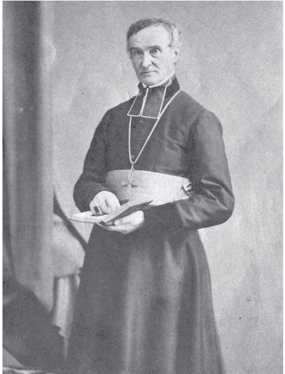
M gr Charles-François Baillargeon. Photo anonyme publiée dans Monseigneur Baillargeon, archevêque de Québec : sa vie, son oraison funèbre, prononcée à la cathédrale, son éloge dans les églises de Québec, ses funérailles, etc. Augustin Côté & cie, Québec, 1870. (BAnQ).

Mais l'Exposition universelle de 1867 a peu de retombées immédiates dans la vallée du Saint-Laurent. En avril 1867, c'est plutôt le tracé prévu du chemin de fer Intercolonial qui suscite l'intérêt. La réalisation de cette entreprise est une des conditions nécessaires à la naissance du nouveau pays en tant qu'union fédérale de la province du Canada avec le Nouveau-Brunswick et la Nouvelle-Écosse. Selon les recommandations du rapport de Sandford Fleming de 1865, la