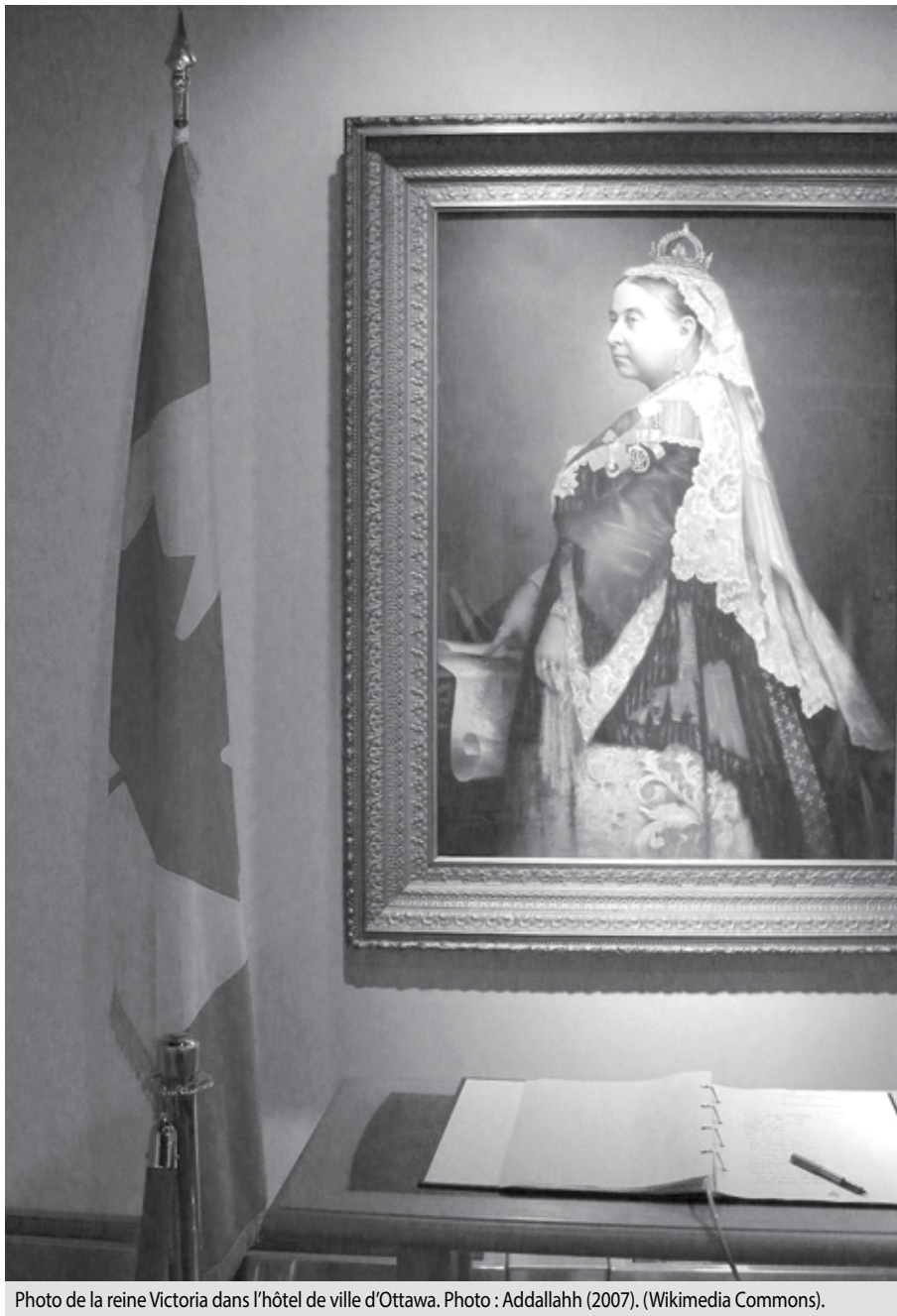
Photo de la reine Victoria dans l'hôtel de ville d'Ottawa. Photo : Addallahh (2007). (Wikimedia Commons).

Aujourd'hui, à l'intérieur de la fédération canadienne, les provinces jouissent, sur le plan juridique, d'une souveraineté véritable dans l'exercice de leurs compétences constitutionnelles. Elles disposent de pouvoirs législatifs qui leur sont propres et d'importantes sources de revenus. Toutefois, dans les faits, cette souveraineté doit être relativisée à la lumière d'un certain nombre de facteurs susceptibles de favoriser la centralisation du régime canadien, comme le pouvoir du Parlement de légiférer en matière d'urgence et d'intérêt national, le pouvoir de ce même parlement de soumettre à son autorité certains ouvrages ou entreprises de nature