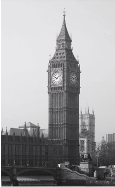
La tour de Big Ben, au palais de Westminster à Londres, vue depuis la Tamise.

locale, la prépondérance des lois fédérales sur les lois provinciales en cas de conflit entre celles-ci, le droit du gouvernement du Canada de dépenser dans les champs provinciaux, la compétence du Parlement à l'égard des matières résiduelles, la possibilité pour le Parlement d'empiéter sur les compétences provinciales, notamment par l'utilisation de ses pouvoirs accessoires, la prépondérance fiscale de l'ordre fédéral de gouvernement, le principe voulant que les lois fédérales puissent lier les provinces, mais pas l'inverse, etc.