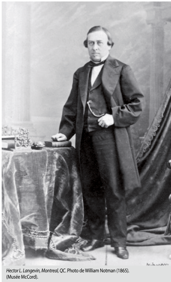
Hector L. Langevin, Montreal, QC.

à ce jour, quoique certains États unitaires puissent avoir des traits fédéraux ou être carrément en voie de fédéralisation, et quoique certains États fédéraux puissent être gouvernés comme s'ils étaient unitaires.