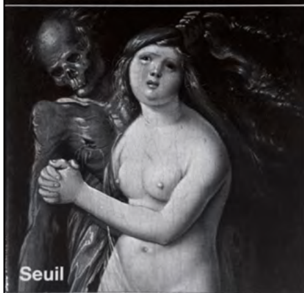
Philippe Ariès. Essais sur l'histoire de la mort en Occident. Paris, Seuil, 1975, 222 p.

premiers habitants de Québec ont immigré avec l'univers mental propre aux Français du XVII e siècle. Ils ont le même culte de la tradition, le même esprit de résistance face au découragement, la même peur de l'ennemi qu'il soit Anglais ou Iroquois et la même spiritualité dominée par le catholicisme issu de la contre-réforme. Ainsi, la mort d'Hébert, en 1627, est complètement différente de celle que nous vivons de nos jours. Dans notre société postindustrielle, la mort est complètement individualisée et est devenue presque tabou. Le deuil est évacué comme non productif et la mort a été reléguée hors de la vie. Au contraire, pour Hébert et ses contemporains, la mort est un événement communautaire. Le mourant est dans sa maison, de préférence dans son lit. Le rituel des derniers sacrements est public : le mourant est accompagné de sa famille, de ses enfants, de ses amis et même d'Amérindiens; il sait qu'il va mourir et il accepte sa mort sans mélancolie. Cette attitude est qualifiée de mort apprivoisée par Philippe Ariès dans son Essai sur l'histoire de la mort en Occident publié en 1975. Cette mort apprivoisée est une continuité spirituelle de la vie et elle se vit en collectivité. Le mourant n'accorde pas la même importance au testament qu'aujourd'hui puisqu'il dicte ses der-