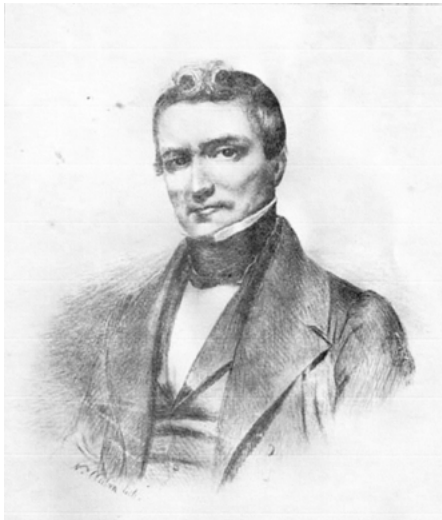
Cette lithographie de Louis-Joseph Papineau le montre quelques années après la rédaction des 92 Résolutions. Napoléon Aubin (attribué à). Papineau. Québec, Napoléon Aubin & W.H. Rowen, 1840. (BAC-Mikan 3019447).

sont pas les seuls à venir des îles Britanniques. À partir des années 1840, les townships connaissent aussi une vague d'immigration irlandaise et écossaise. Selon les chiffres compilés par le CEFAN, en 1852, les Cantons de l'Est comptent plus de 60 000 habitants anglophones. Malgré cette croissance démographique, Drummondville tarde à s'affirmer comme capitale régionale. En fait, c'est plutôt l'inverse : la ville ne s'urbanisera et ne prendra de l'expansion qu'à partir de la seconde moitié du XIX e siècle lorsque son économie sera reliée à Montréal, Québec et Trois-Rivières plutôt qu'à celle des cantons.