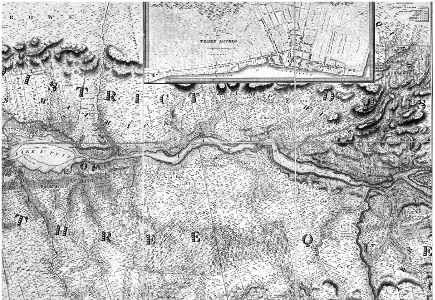
À l'est du canton de Grantham, on peut lire sur le site de Drummondville : « Rapids almost impassable ». Joseph Bouchette. This Topographical Map of the Province of Lower Canada... Londres, William Faden, 1815, détails.

Dans quelle mesure cette stratégie de peuplement favorise-t-elle le développement de Drummondville au XIX e siècle? Les townships sont d'abord peuplés par des loyalistes au début du XIX e siècle. Ceux-ci s'établissent au sud de la région et ont peu de liens avec les pionniers qui accompagnent Frederick George Heriot. Puis à partir des années 1820, une courte vague d'immigration anglaise arrive dans les cantons. Ces nouveaux arrivants ne