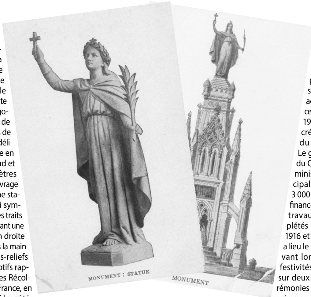
Cartes postales officielles du 3 e centenaire de l'établissement de la foi au Canada, 1615-1915.