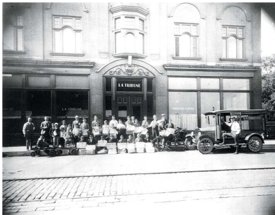
Groupe d'employés du journal La Tribune, devant le Art Building, 1928.