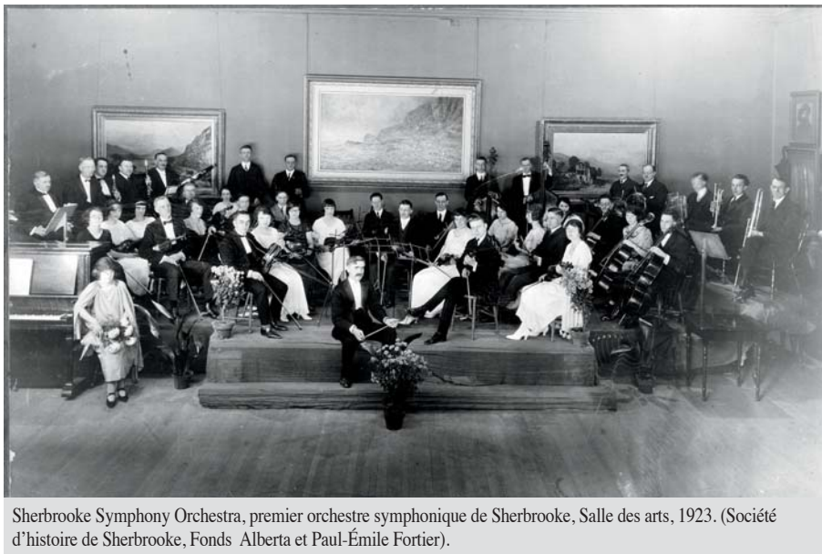
Sherbrooke Symphony Orchestra, premier orchestre symphonique de Sherbrooke, Salle des arts, 1923.