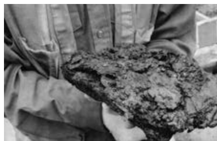
Restes calcinés de plusieurs volumes.

La découverte de quelque 35 fragments calcinés de livres constitue le fait saillant de la campagne de fouilles réalisée à l'été 2013 par la firme Ethnoscop sur le site du Marché-Sainte-Anne-et-du-Parlement-du-Canada-Uni dans le Vieux-Montréal. L'annonce de cette découverte a été faite le 1 er novembre dernier à l'occasion du lancement de la campagne majeure de financement de la Fondation Pointe-à-Callière pour soutenir le Musée et le projet de la Cité d'archéologie et d'histoire de Montréal. Très fragiles, les précieux artéfacts ont été vite envoyés à l'Institut canadien de conservation, à Ottawa, pour évaluer les possibilités de les restaurer à des