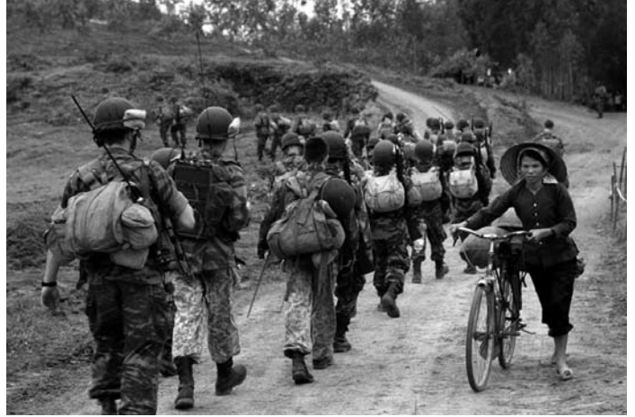
Diên Biên Phú de Pierre Shoendoerffer

militaires et les notables se taillant la part du lion. Parmi une flopée de figures émerge celle d'un imprimeur vietnamien engagé, admirateur de La Fontaine et de Victor Hugo : de la victoire (ou du désastre) de Diên Biên Phú, il dira philosophiquement que son âme tonkinoise en est fière, mais que son âme française en est un peu triste. Une épitaphe ambivalente qui sied bien aux sentiments français face à l'Indochine.