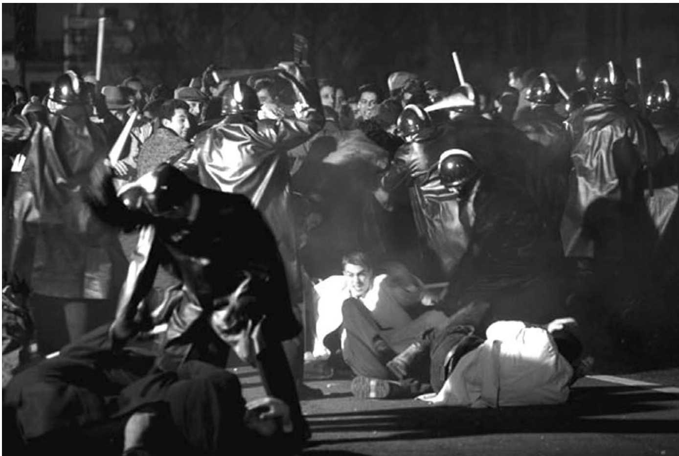
Nuit noire, 17 octobre 1961 d'Alain Tasma

au pugilat avec la police et même au cauchemar lorsque des corps sont jetés dans la Seine. Elliptique et nerveux, le film va à l'essentiel. Les scènes et les personnages se succèdent, sans justification hâtive, sans effusion. Le réalisme choisi par Tasma n'épargne personne et lève le voile sur un épisode « oublié » par les livres d'histoire.