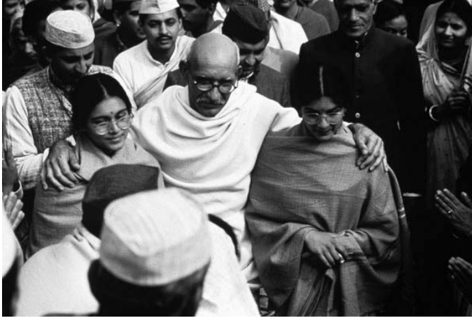
Gandhi de Richard Attenborough