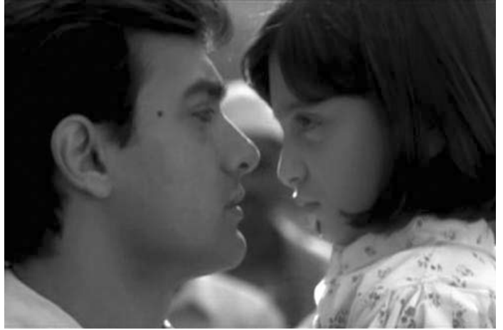
Earth de Deepa Mehta

de la romancière : dans des décors de paradis en déliquescence, à la fois les Français et les locaux trinquent à leurs vices, à leurs humiliations, à leur ruine. Car dès 1945, c'est le début de la fin de l'Indochine française. Le mouvement nationaliste vietnamien, d'allégeance communiste et mené par Hô Chi Minh, prend rapidement le contrôle d'une bonne partie du territoire et proclame même une indépendance unilatérale. Débutent alors huit années de conflits larvés, de guérilla et de diplomatie infructueuse. En métropole, la poursuite de la « sale guerre », meurtrière et surtout très coûteuse, devient de plus en plus impopulaire et difficile à défendre. Après le désastre de la bataille aérienne de Diên Biên Phú (du 13 mars au 7 mai 1954), la France abandonne le combat. La paix est entérinée à Genève malgré le fait que la nation soit toujours divisée entre le nord (communiste) et le sud, menant le pays à une guerre finale d'indépendance et de réunification, communément appelée guerre du Vietnam.