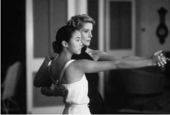
Indochine de Régis Wargnier