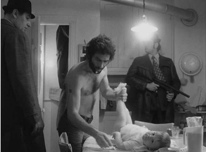
Claude Gauthier dans Les Ordres de Michel Brault