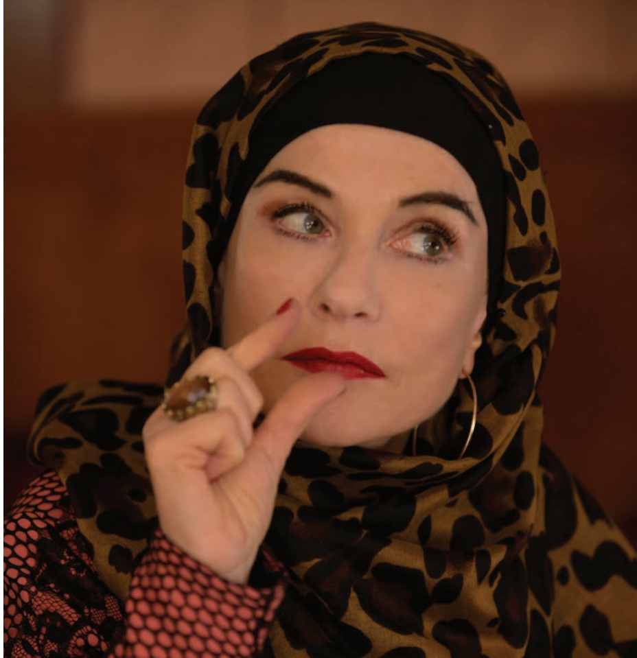
« Dans le rôle de Patience Portefeux, Isabelle Huppert fait la démonstration, si cela était encore nécessaire, que la comédie lui convient aussi bien que le drame. »

Dans le rôle de Patience Portefeux, Isabelle Huppert fait la démonstration, si cela était encore nécessaire, que la comédie lui convient aussi bien que le drame. Elle incarne avec un plaisir évident cette héroïne imprévisible, aussi à l'aise en traductrice manipulatrice qu'en trafiquante retorse, trompant avec autant d'aisance ses collègues du Quai des Orfèvres et ses nouveaux « amis ». En