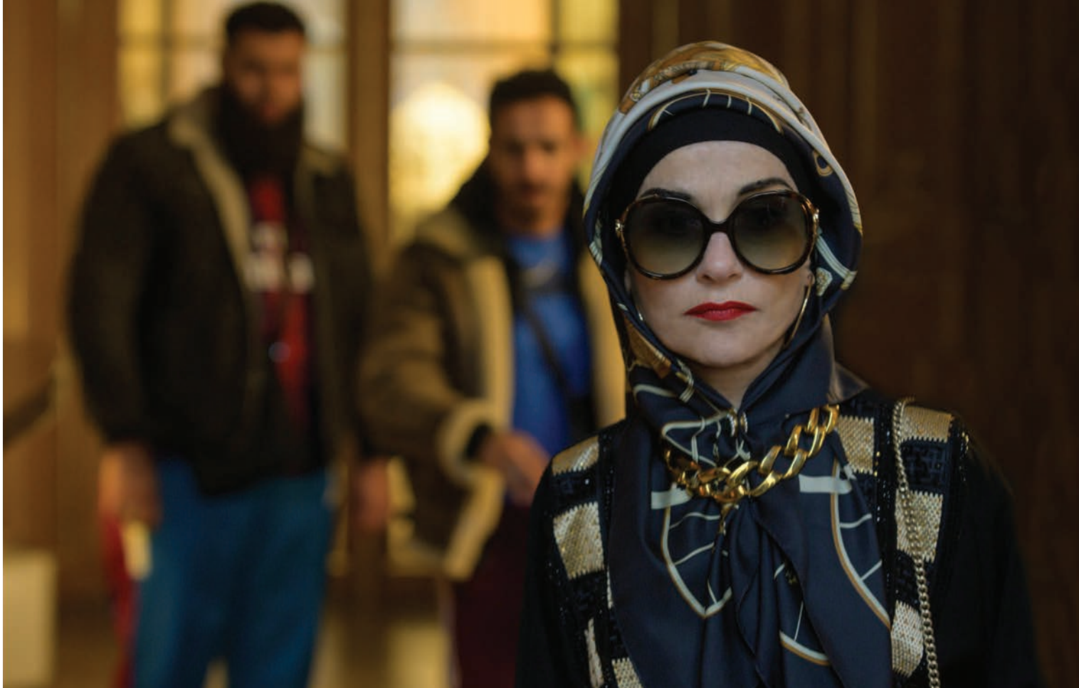
La Daronne qui mystifiera tous les camps.

de flics qui la pistent sans jamais parvenir à la coffrer, entraîne le lecteur dans un récit palpitant et rocambolesque, qui slalome avec une belle aisance entre le polar désinvolte et la comédie décalée. Sans compter la relation de Patience avec Philippe, beau flic transi d'amour, qui apporte juste ce qu'il faut de chair à cette histoire où le suspense s'avère, au final, assez secondaire. Car c'est d'humanité dont il est surtout question ici, dans ses grands principes de justice autant que dans les petites combines auxquelles on doit parfois se livrer pour survivre dans un monde souvent hostile, toujours inégalitaire, malgré ce que prétend la devise de la République. Voler des dealers tout en faisant un immense pied de nez à un système de justice qui vous exploite n'est peut-être pas si terrible finalement!