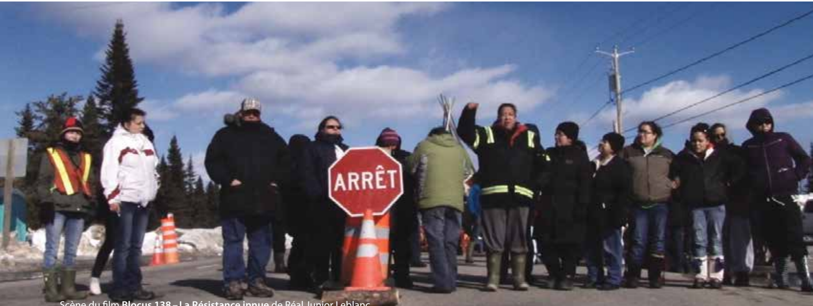
Scène du film Blocus 138 – La Résistance innue de Réal Junior Leblanc